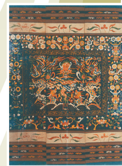
清代黎族五龙出海图龙被。