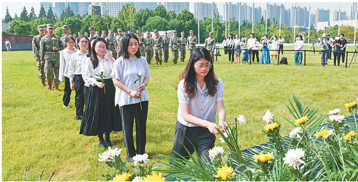
2023年9月3日，各界代表在侵华日军南京大屠杀遇难同胞纪念馆举行的中国人民抗日战争暨世界反法西斯战争胜利78周年纪念活动中敬献鲜花。