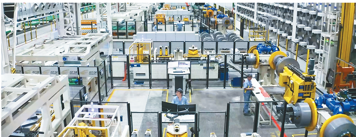
金盘科技海口数字化工厂。

近年来,越来越多海南“小巨人”及单项冠军企业把“走出去”开展海外创新投资与合作当作长期发展战略,深度融入全球价值链,不断提升企业国际竞争力,在资本合作、技术合作、市场拓展和商业模式创新等方面取得良好成效。金盘科技不断完善发展链条,产品和服务遍布全球84个国家及地区,主要产品获得国内外278个权威认证,2023年上半年集团外销订单10.48亿元(含税),较去年同期增长157.49%。苏生生物目前正在开拓南美、东南亚、东欧等地区市场。云码智能(海南)科技有限公司通过注册公司对接出口业务,产品目前主要出口到印度等国家。