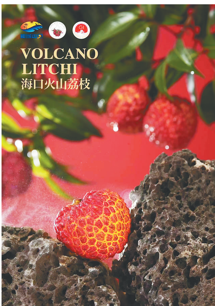
借助“椰城香见”农产品区域公用品牌，海口火山荔枝持续提升竞争力。