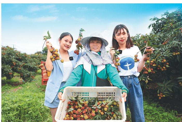
海口举办“2023椰城香见·海口火山荔枝月”系列活动。