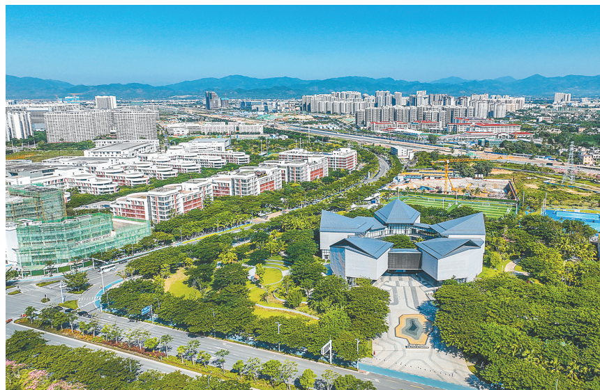
截至今年11月，三亚崖州湾科技城累计注册外商投资企业(含港澳台)超130家。