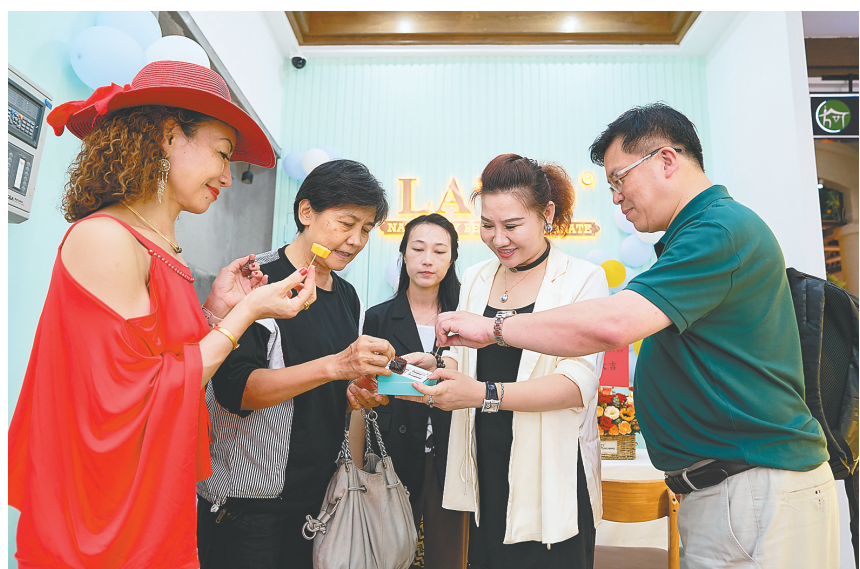
海口市游客在LATIO加拿大巧克力体验店试吃巧克力。