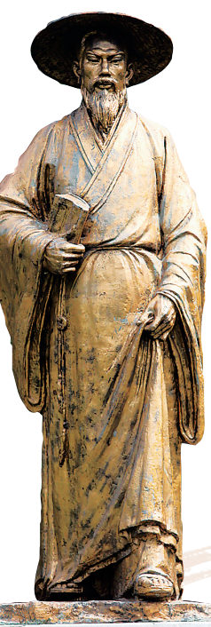
儋州市东坡书院里的苏东坡塑像。