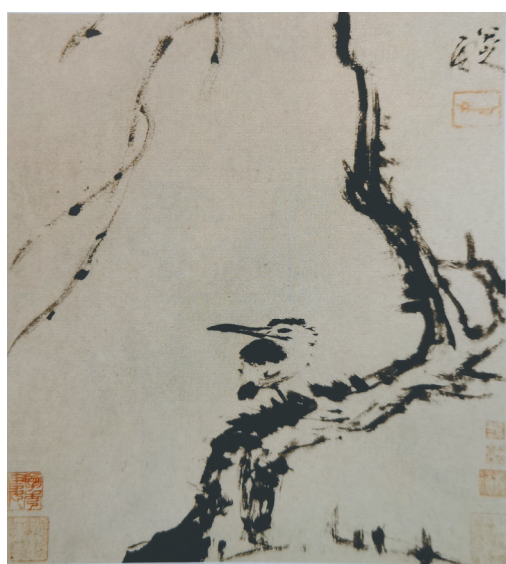
八大山人的《枯柳孤鸟图》。 资料图

无论是画中的枯柳，还是孤鸟，透过画面，让人感到孤鸟不寒，反而表现出一种不屈的情态。