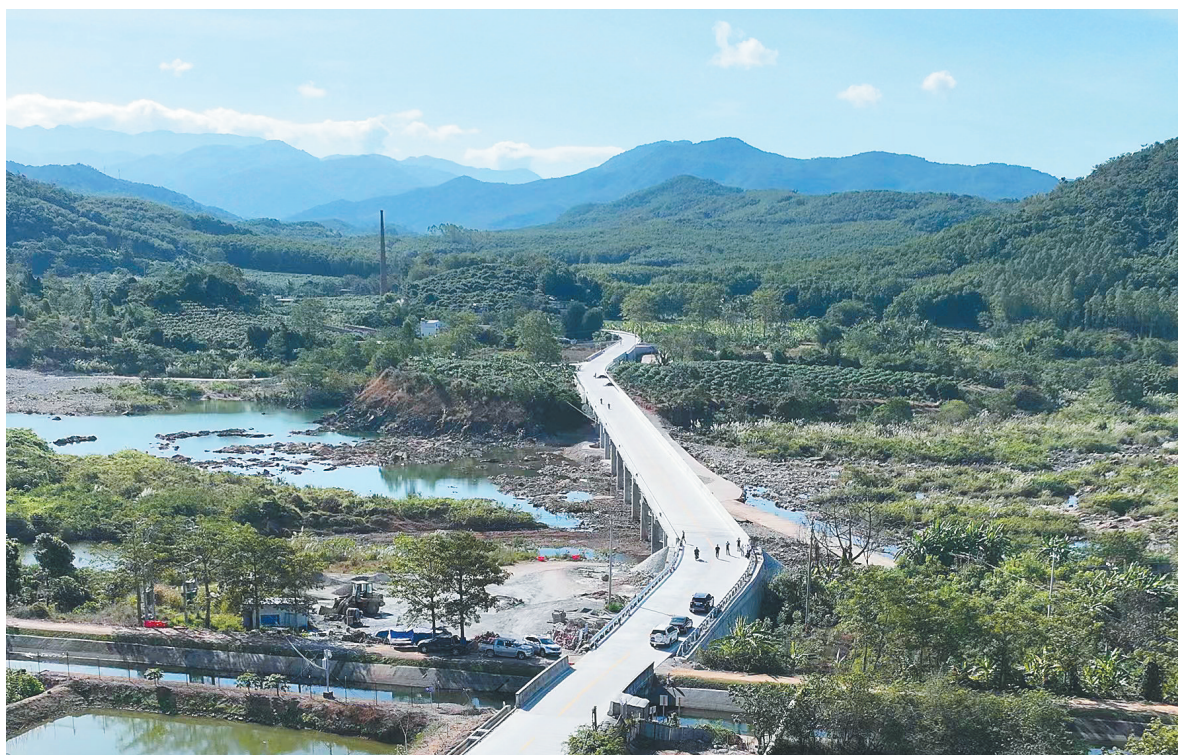
改建完工后的牙营村漫水桥。

“通过加强技术管理、明确岗位职责，认真做好技术交底工作，主要分项工程质量严格把控，坚持自检、交接检、专项检三项检查的制度，确