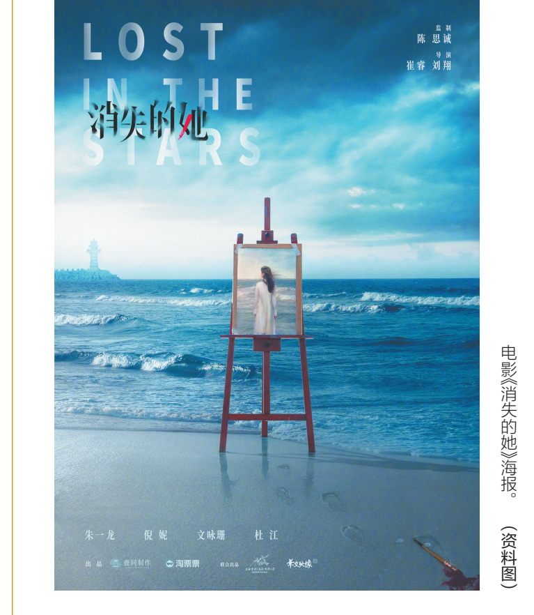
电影《消失的她》海报。(资料图)

■ 本报记者 黄媛艳 12月16日,电影人的“三亚聚会”如约而至。国内外新老电影人乘着光影汇聚鹿城,既为打造一场国际文化交流的饕餮盛宴,也为吸引世界目光聚焦三亚。 “打卡中国电影中的旅游胜地”正成为当下时尚。地处“黄金旅游带”的三亚,同样也是可以全年全域全时取景拍摄的“天然摄影棚”,穿过银屏走进美景,越来越多观众借助光影的纽带变成游客来到三亚。 与影同行,奔赴鹿城,三亚要搭上这股影视文化热;光影聚能,产业提档,三亚正推动文化产业高质量发展。