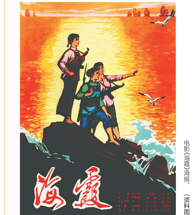
电影《海霞》海报。(资料图)