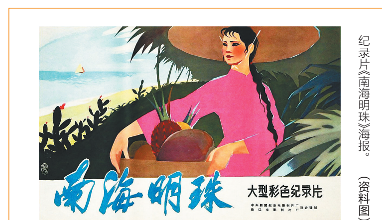
纪录片《南海明珠》海报。(资料图)