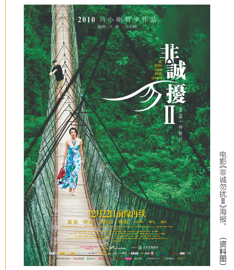
电影《非诚勿扰II》海报。(资料图)