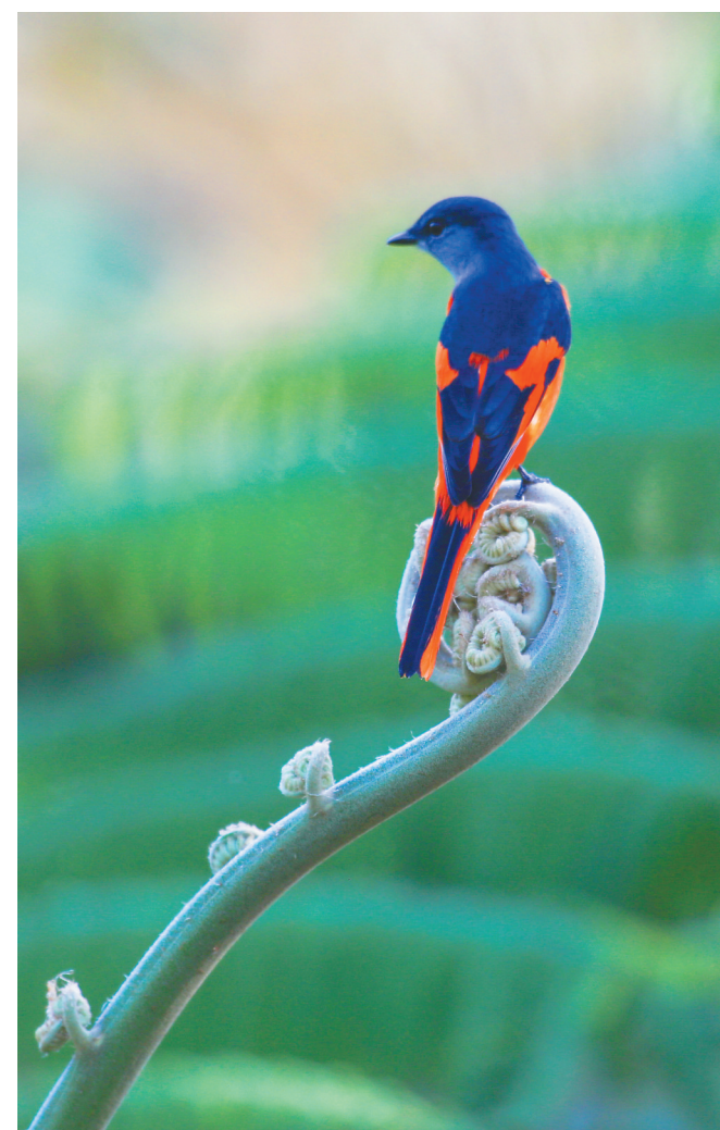
海南热带雨林国家公园五指山片区里的灰喉山椒鸟。