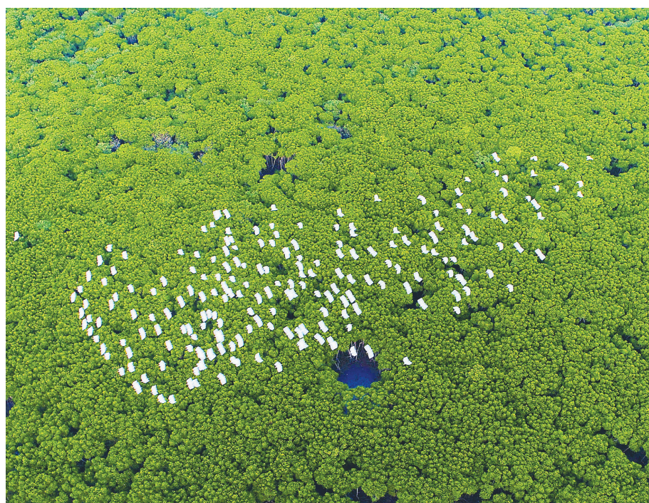
海口东寨港湿地候鸟纷飞。