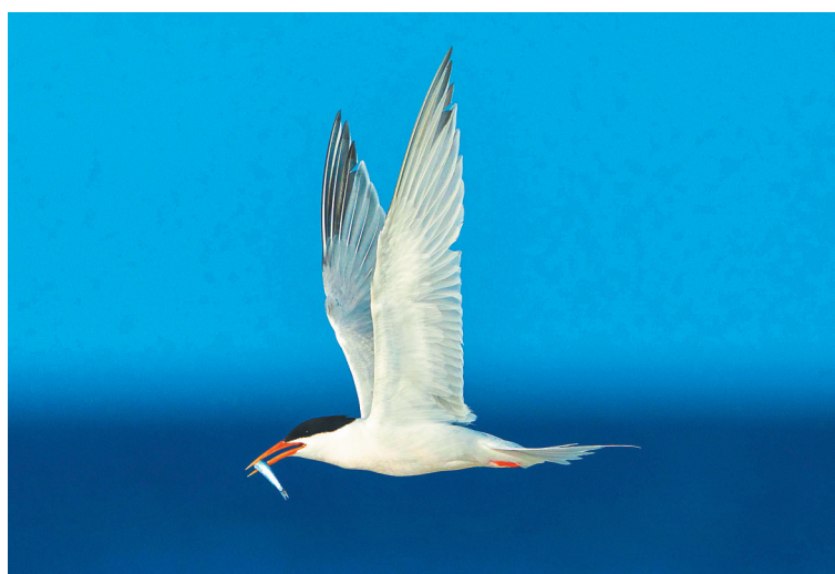
三沙北岛，一只捕食的粉红燕鸥。