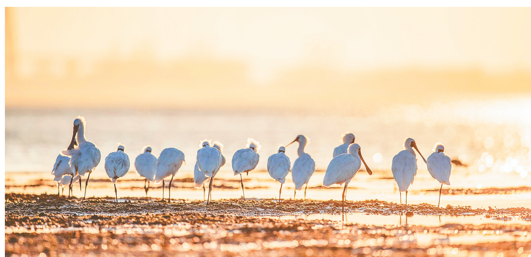
儋州新英湾，一群黑脸琵鹭在暖阳中栖息。