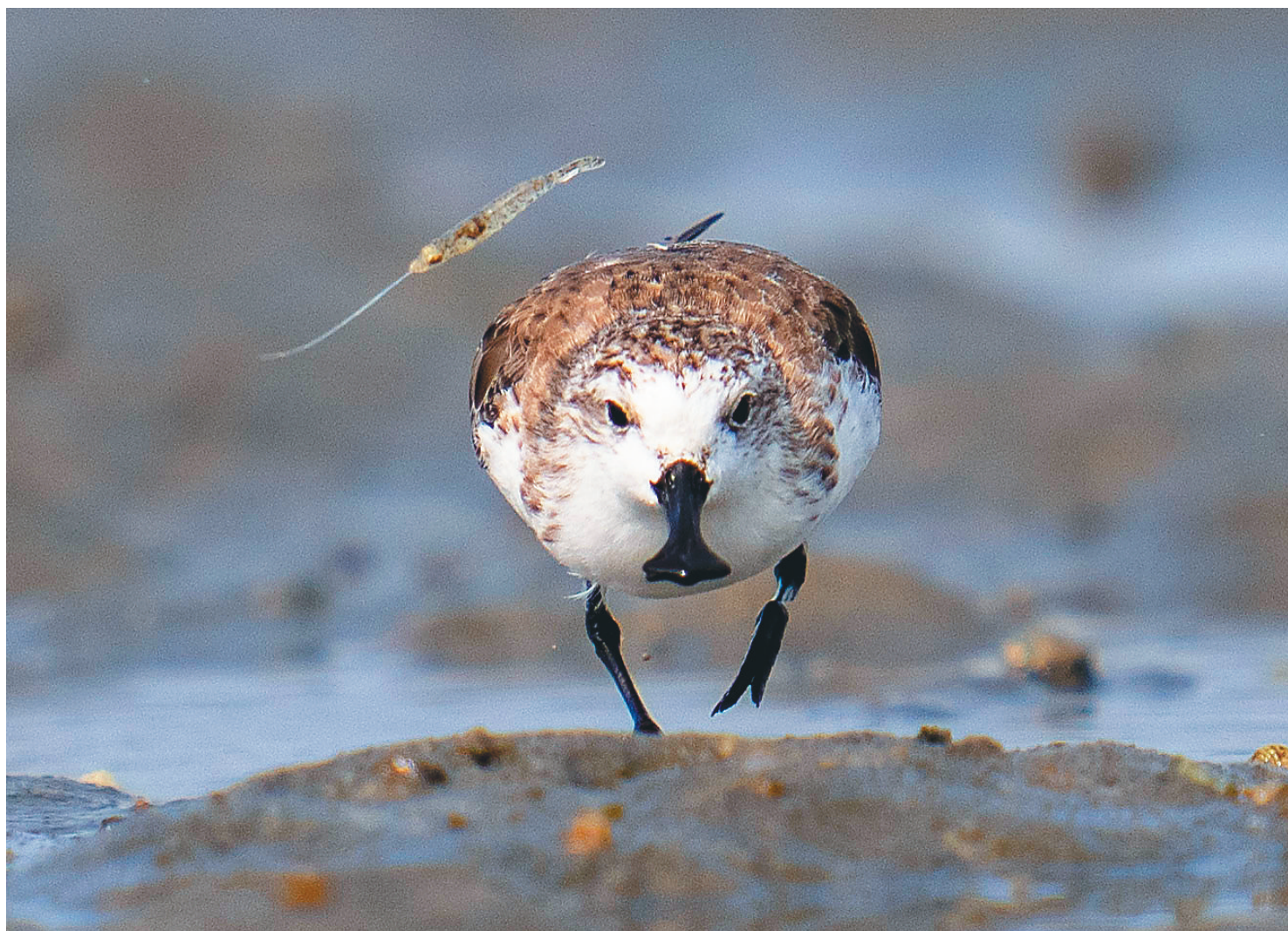
儋州湾，一只勺嘴鹬在抓捕小虾。