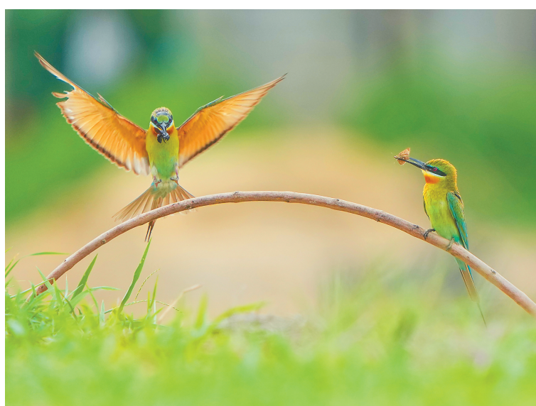
栖息在澄迈花场湾自然生态保护区的栗喉蜂虎。李天平 摄

我们用一张张用心拍摄的图片、一个个充满故事性的瞬间，带你读懂海南，爱上海南！让我们一起分享海南的美。