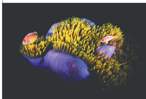
甜蜜家园。