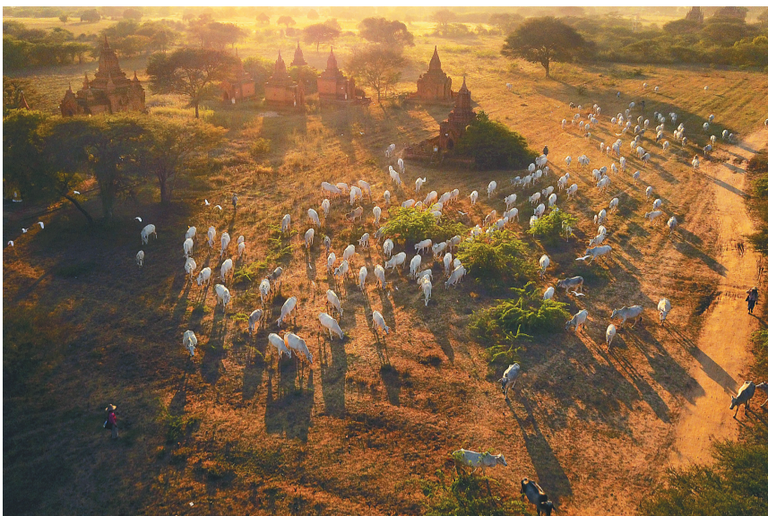
田野上的牛群。

近日,首届三亚国际摄影周开幕,在三亚国际游艇中心和三亚艺海棠艺术综合体共展出来自土耳其、格鲁吉亚、匈牙利、沙特阿拉伯、印度尼西亚、葡萄牙、埃及、菲律宾、美国、瑞典、德国以及中国等近20个国家50多位中外知名摄影家的精彩作品。