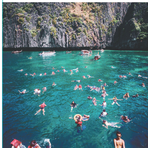
泰国普吉岛。