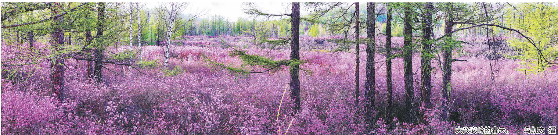
大兴安岭的春天。