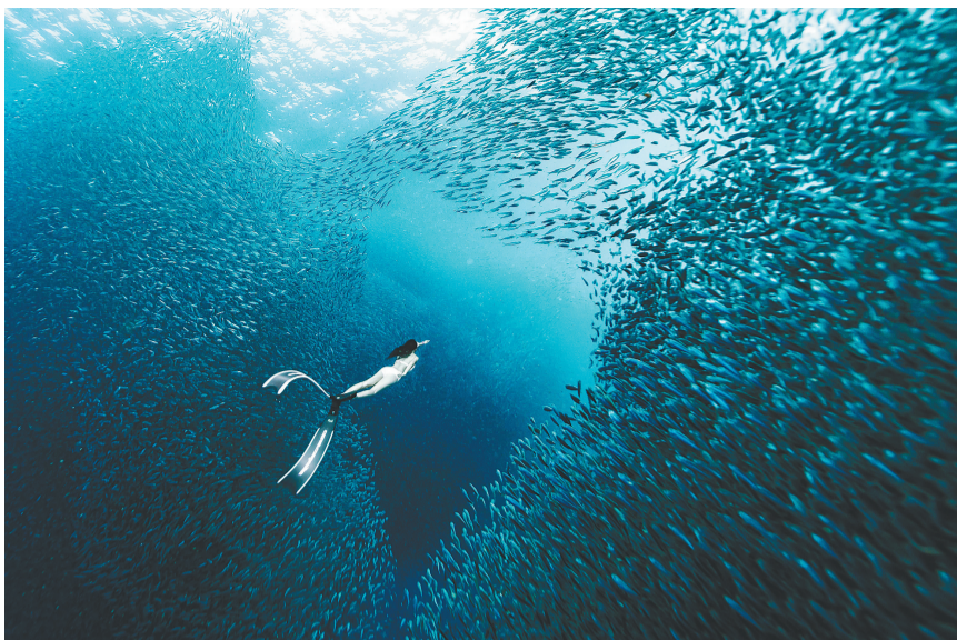
我心飞翔。