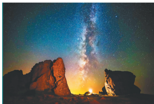
呼和浩特大青山。