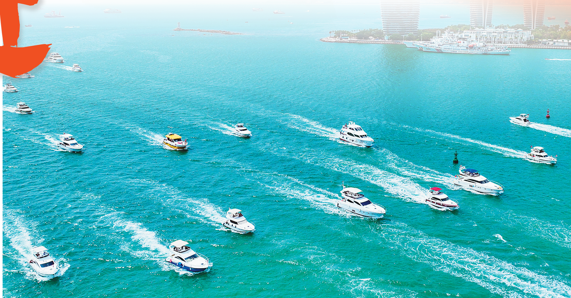
三亚湾海域，大批游艇出海。(资料图)

一年来，全省上下坚持稳中求进、循序渐近、踔厉奋进，着力把全面深化改革开放向更广范围、更大力度、更深层次推进，持续拓展“进”的空间，增强“进”的动力，提升“进”的成效。接下来，我们将树立不进则退、慢进亦退的理念，在推进制度创新、促进产业升级、增进民生福祉等方面久久为功，为加快建设具有世界影响力的中国特色自由贸易港、谱写中国式现代化海南篇章作出新的更大贡献。