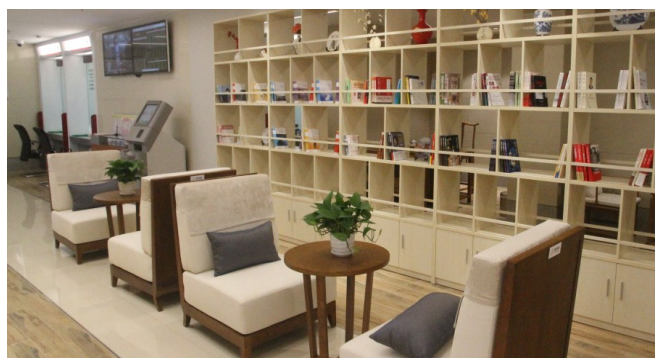
海南中行三亚北支行养老服务示范点。

绿水青山就是金山银山。自贸港东风正劲，海南中行积极抢抓“双碳”机遇，以金融之力不断加强海南自贸港低碳经济、循环经济、绿色经济的扶持力度，为绿色产业发展保驾护航。