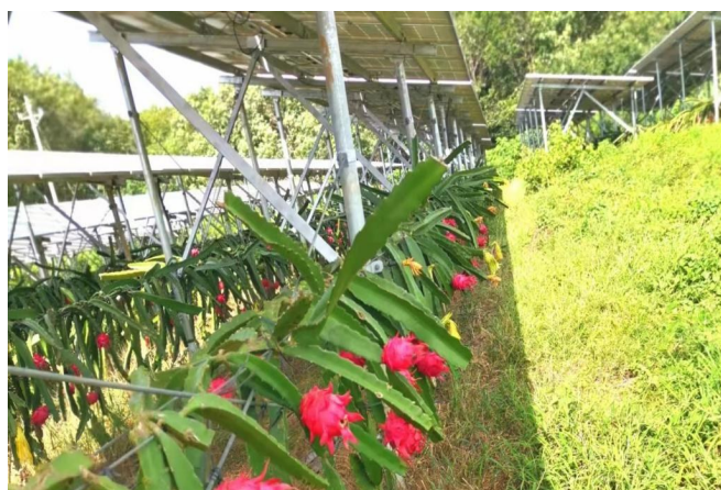
海南中行普惠金融支持的火龙果项目基地。