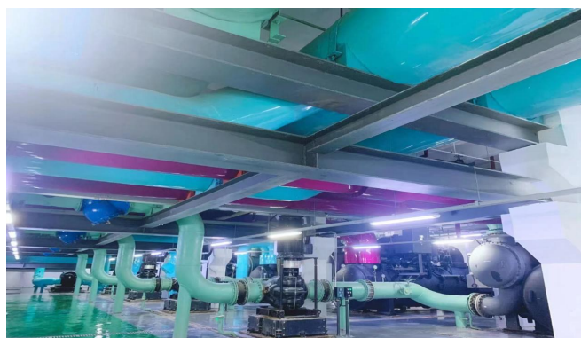
三亚低碳智慧能源综合利用海棠湾示范区项目制冷机组。