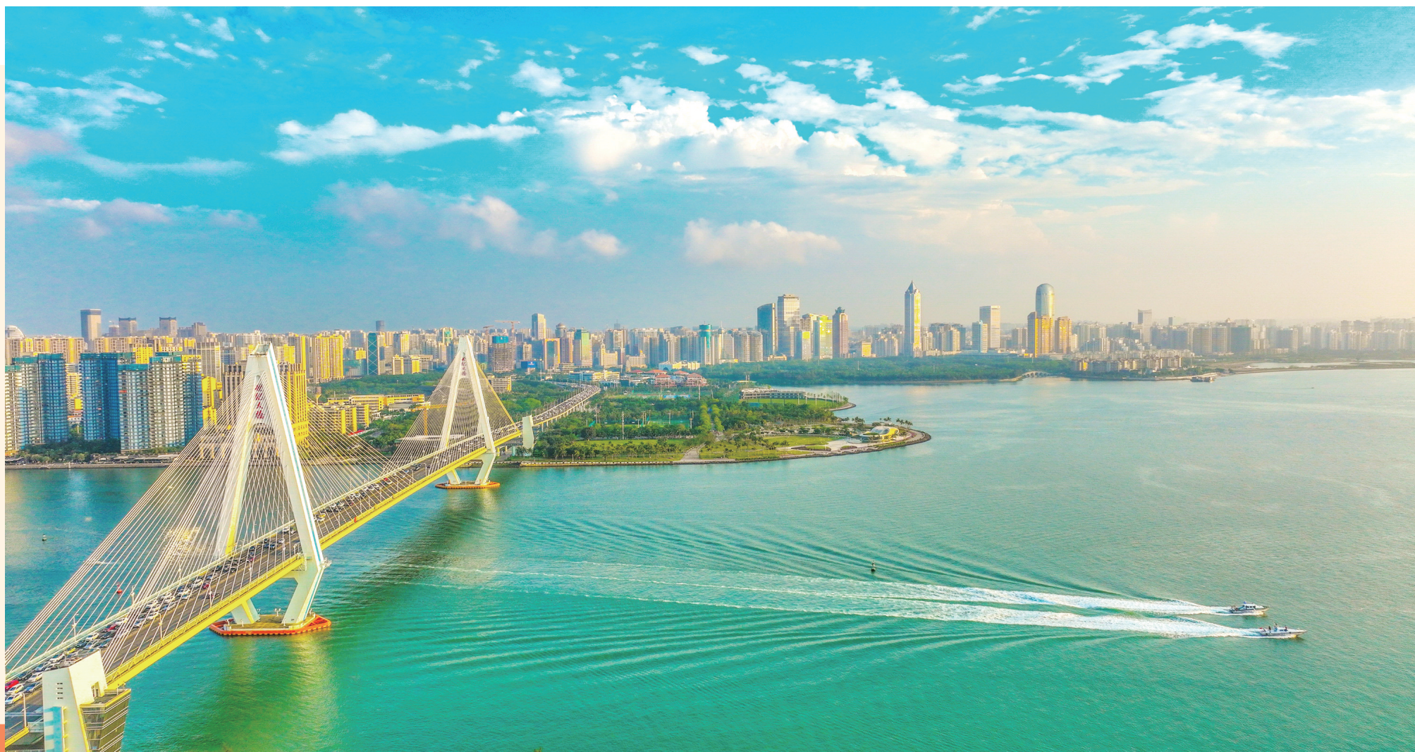
航拍海口城市风光。

近期召开的中央金融工作会议提出做好科技金融、绿色金融、普惠金融、养老金融与数字金融五篇文章，加快建设金融强国。中国银行海南省分行（以下简称海南中行）锚定海南自贸港“一本三基四梁八柱”战略框架，积极服务国家战略，年初发布《关于金融支持“加快建设海南自由贸易港”二十条措施》，不断将金融资源投向自贸港“四大主导产业”“三大未来产业”以及13个重点园区，当好服务自贸港实体经济的“排头兵”，全力支持自贸港高质量发展。截至11月末，该行累计投放信贷资金近1000亿元，人民币贷款新增254亿元，增幅27.86%。