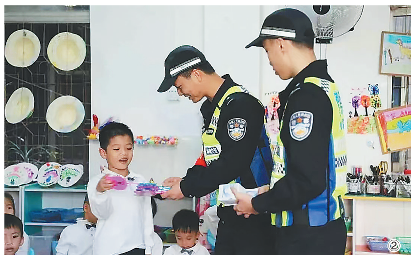
①临高县和舍镇和舍中心学校“向上班”学生上体育课。