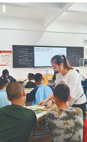
东方市感恩学校开展公开课活动。