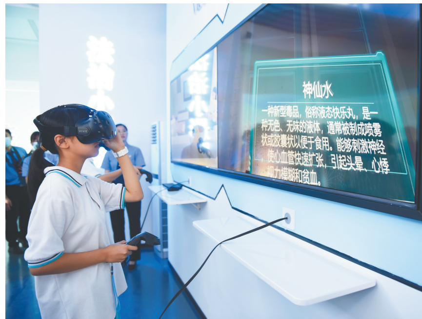
三亚中小学生在沉浸式体验中学习禁毒知识。