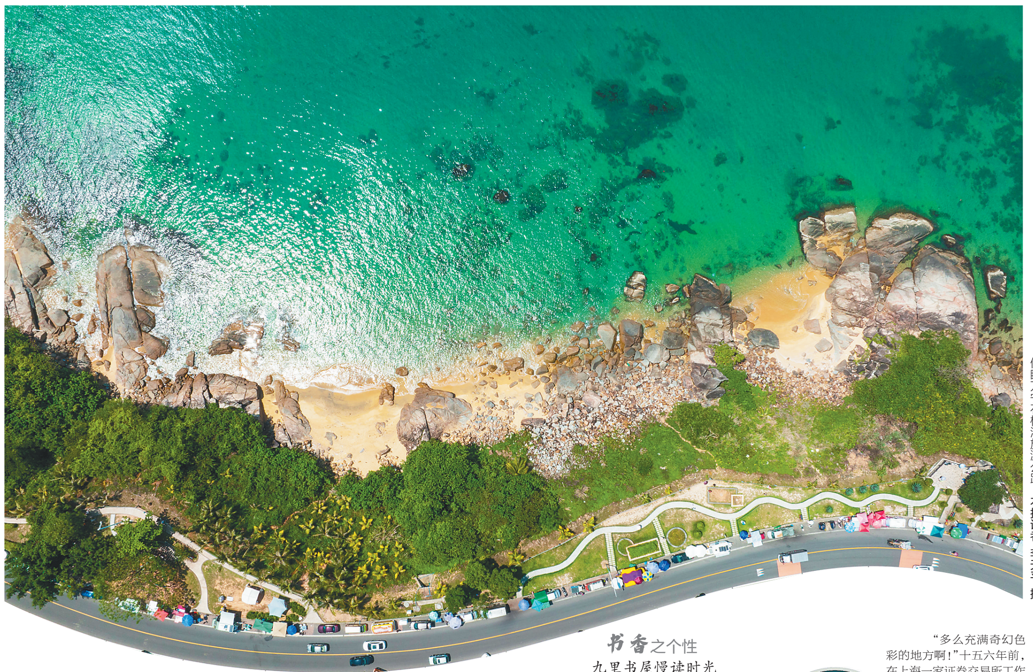
俯瞰万宁石梅湾旅游公路。

2015年1月,在海南省举办的“海南十大最美海湾”评选中,万宁石梅湾荣膺榜首,荣获“海南十大最美海湾”美誉。