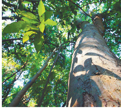
青皮树。石梅湾青皮林地里的。