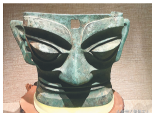
三星堆的青铜面具。

近日，纪录片《何以中国》在东方卫视播出，引发诸多关注。该片立足于“中华文明探源工程”和“考古中国”的重大研究成果，系统性追溯了中华文明的根基、起源、形成与早期发展的历程，力图让观众提供“何以中国”的答案。