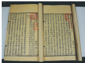
清羊城骆氏翰墨园刻本《史记》内页。