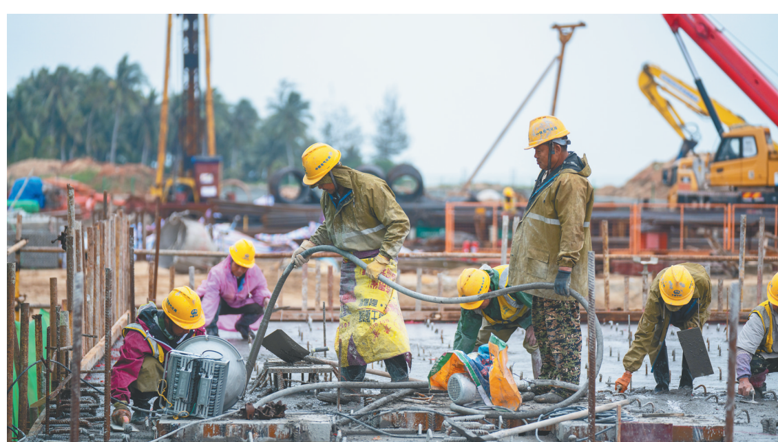
近日,在海南商业航天发射场2号发射工位,工人在加紧施工。

据悉,2号发射工位是我国首个液体通用型发射工位,可兼容10家火箭公司19个型号的火箭发射。导流槽主体结构顺利完成,为接下来的设备以及油气管线安装等施工任务打下了坚实基础。目前,项目设备用房、避雷塔施工都在陆续进行,接下来各单体工程将按照工程节点加紧施工,为项目推进加足“马力”。