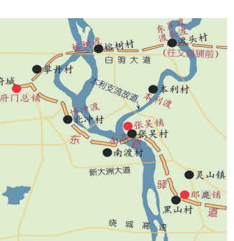
明清时期南渡江三角洲各主要渡口，橙色虚线为驿道。