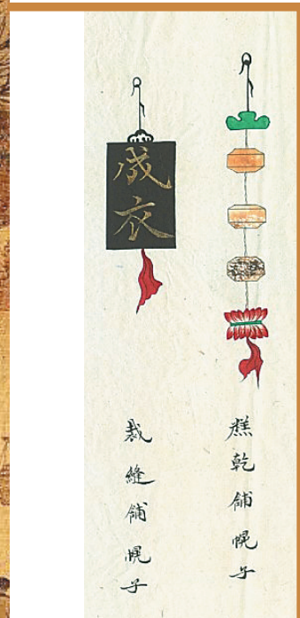
我国古代招幌(广告牌)。资料图

从这个意义上说，“明星站台”自古就有，广告效应更是胜过今人，而这大概就是文学所蕴含的千古魅力吧。