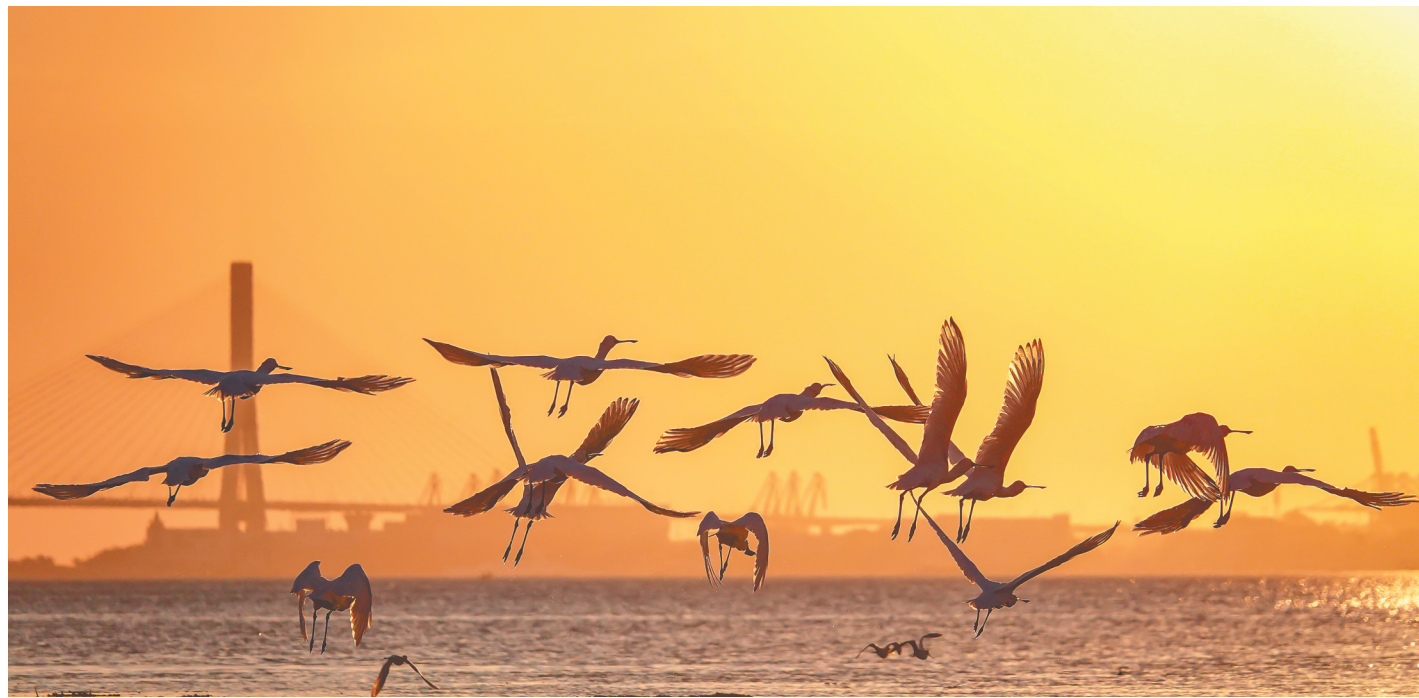
海南儋州湾,一群黑脸琵鹭展翅飞翔。