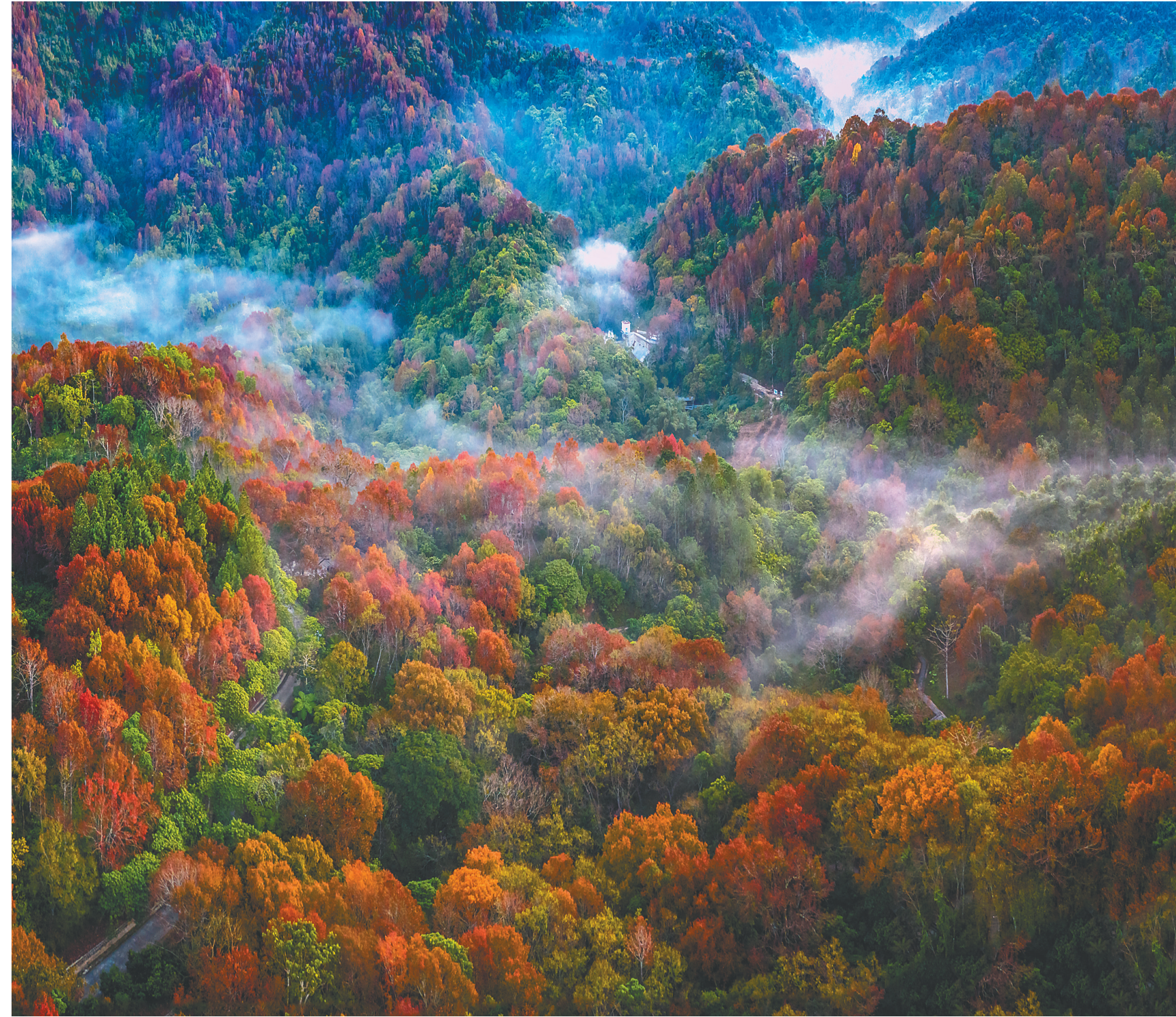
海南五指山,七彩雨林。