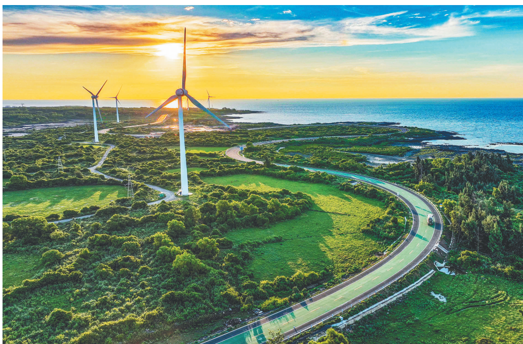
海南环岛旅游公路儋州峨蔓段。