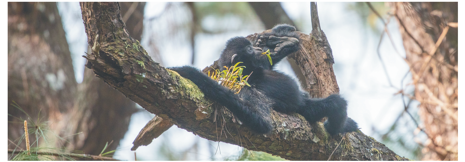
海南热带雨林国家公园霸王岭片区,海南长臂猿躺在松树上采食石斛。