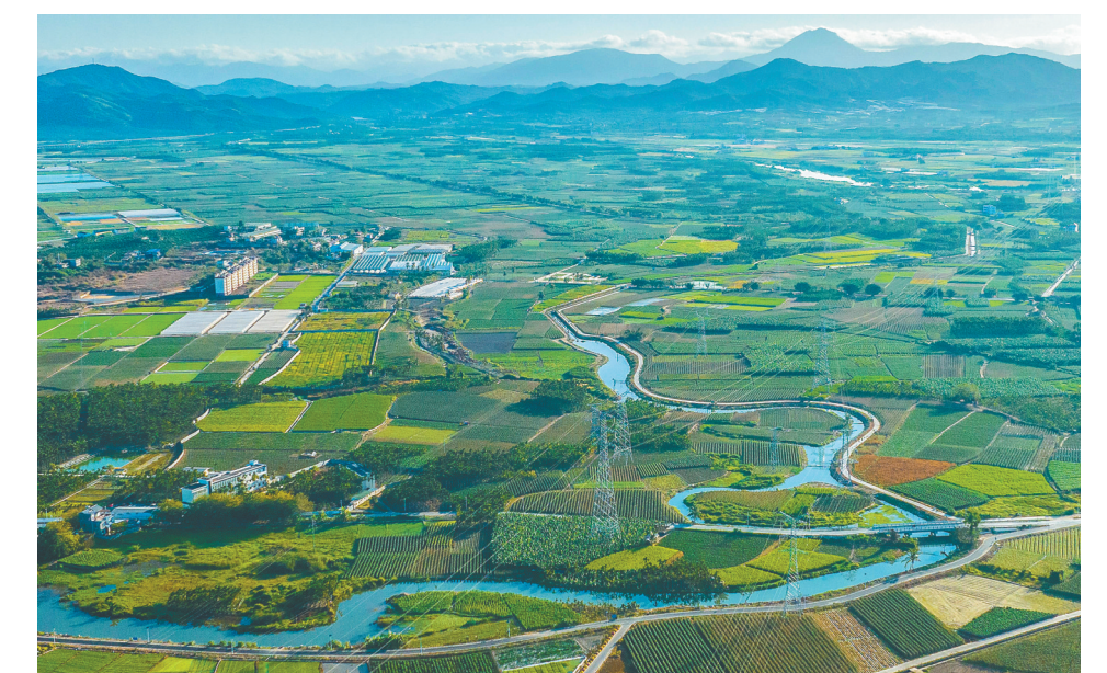
海南三亚,农业现代化示范区。