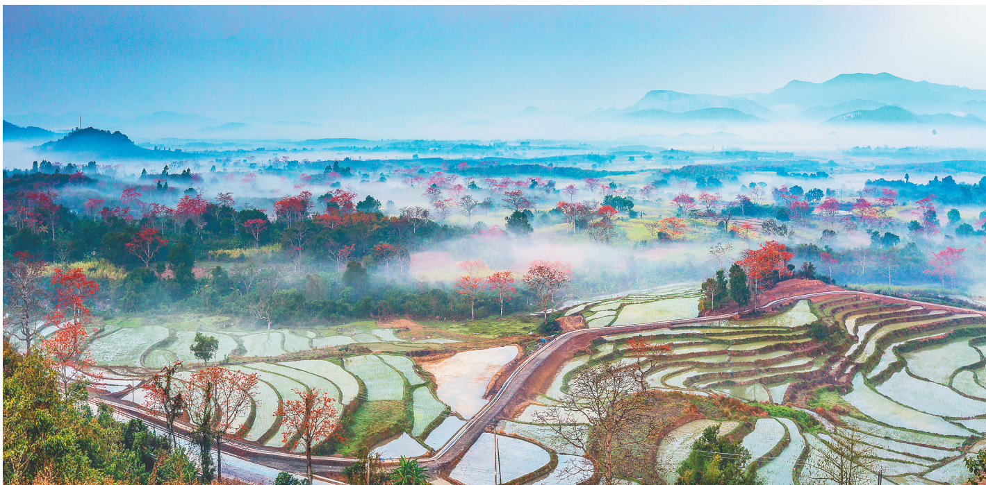
海南昌江,宝山梯田。