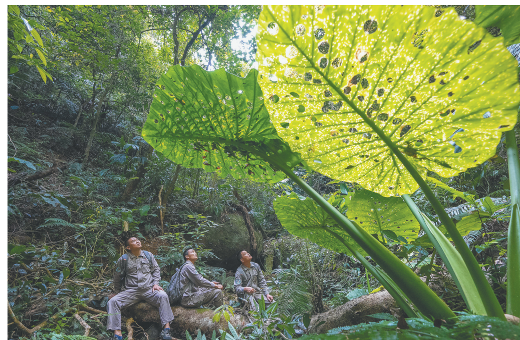
海南热带雨林国家公园五指山片区,护林员在巡山。