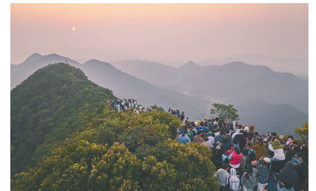
海南乐东,尖峰岭绝美日出。