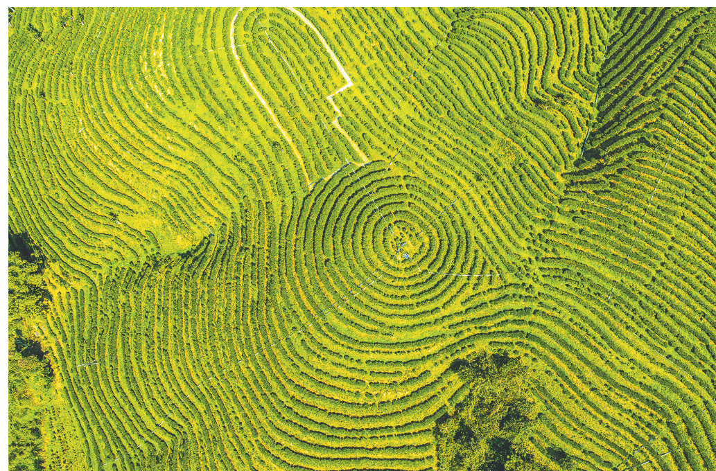
海南五指山,茶园“绿海”满山。