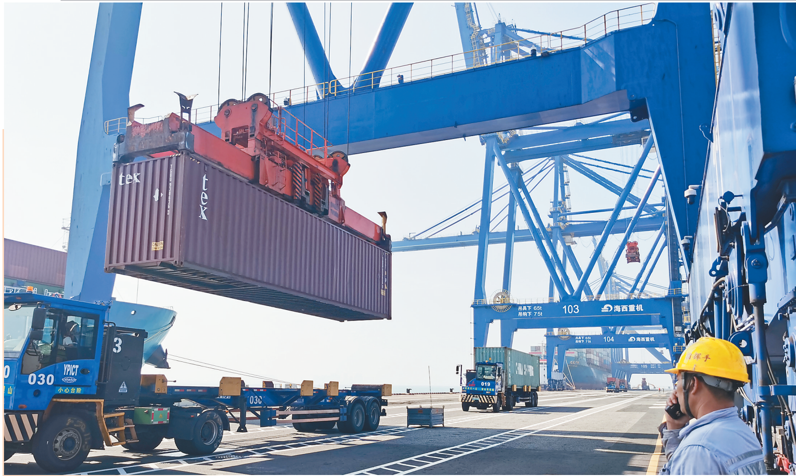
洋浦国际集装箱码头指挥手李开志指挥岸桥操作手卸货作业。