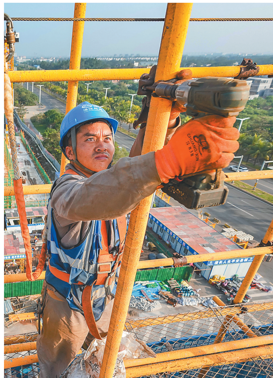
1. 海南国际商业航天发射场，建设者在避雷塔上作业。