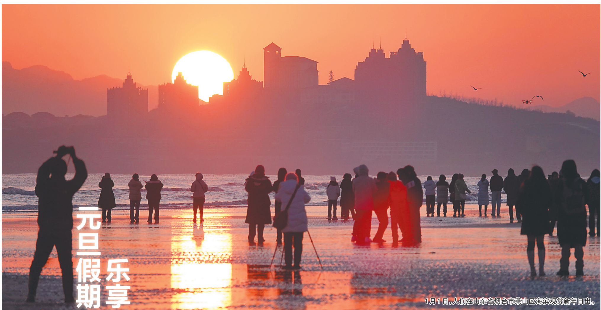
1月1日，人们在山东省烟台市莱山区海滨观赏新年日出。