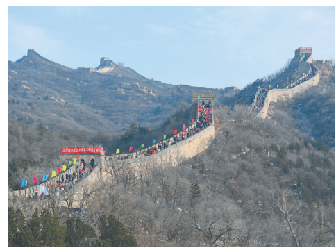
游客攀登北京八达岭长城，用登高健身的方式喜迎新年。