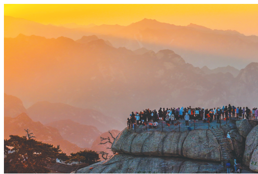
游客在位于陕西省渭南市的华山西峰赏景。

元旦假期期间，人们用各种方式乐享时光，迎接新年，欢度假期。（本栏图片均由新华社发）