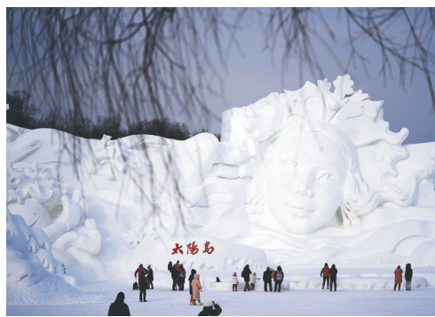
游客在黑龙江哈尔滨太阳岛雪博会园区内游玩、拍照。