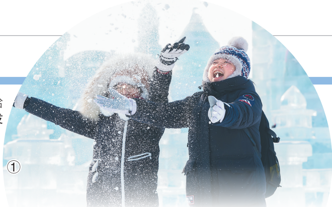
①②③④照片均为游客在哈尔滨冰雪大世界游玩。