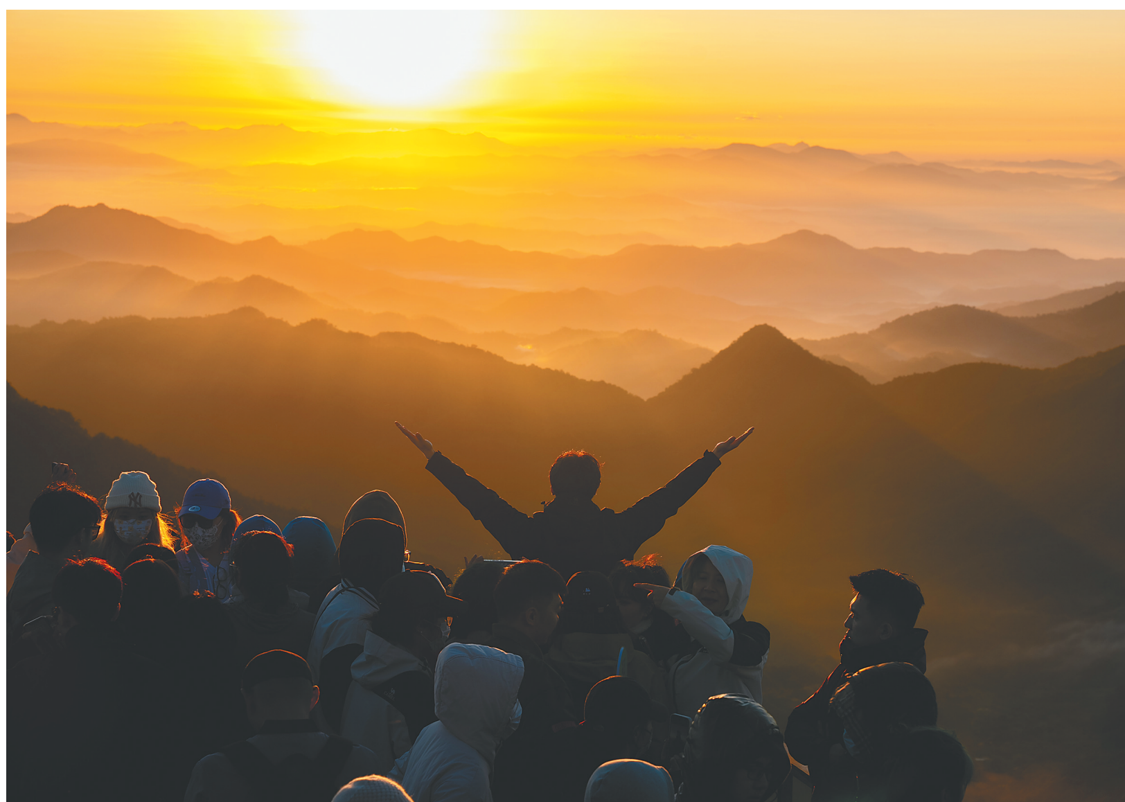
游客在尖峰岭迎接日出。

我们用一张张用心拍摄的图片、一个个充满故事性的瞬间，带你读懂海南，爱上海南！一起分享海南的美。