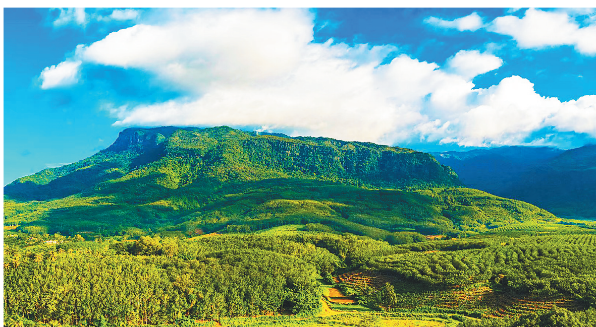
风景秀丽的佳西自然保护区。