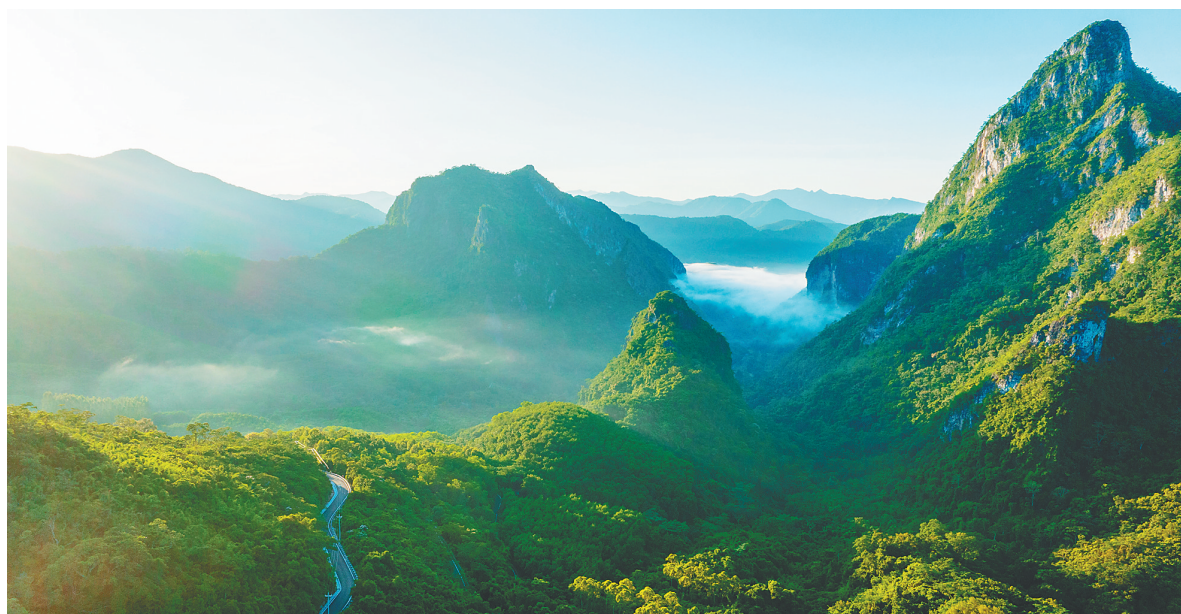
山海互通旅游公路在霸王岭中蜿蜒。