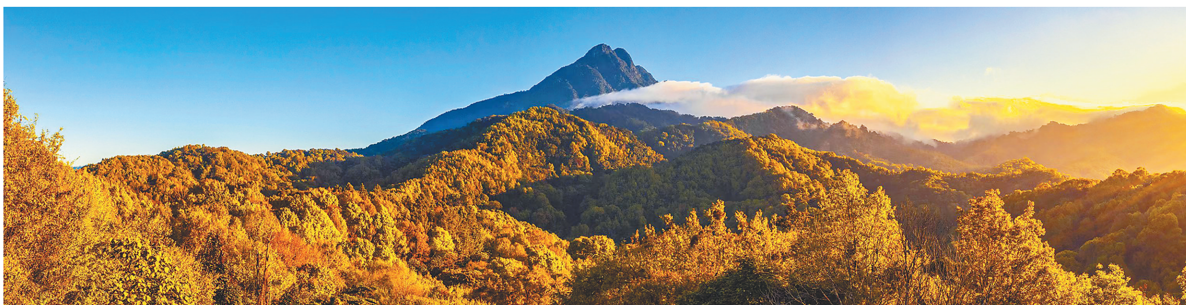
五指山下层林尽染。