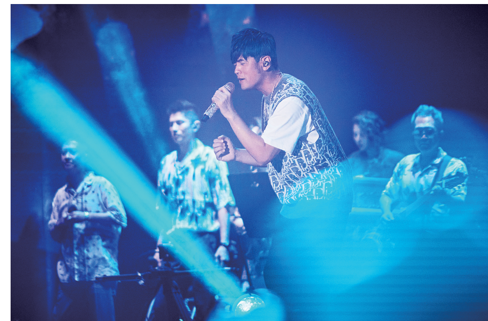
2023周杰伦嘉年华世界巡回演唱会在海口举办。