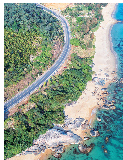
航拍海南环岛旅游公路。

旅游总收入 2070亿元 同比增长 14% 接待入境游客超 100万人次 同比增长近翻一番