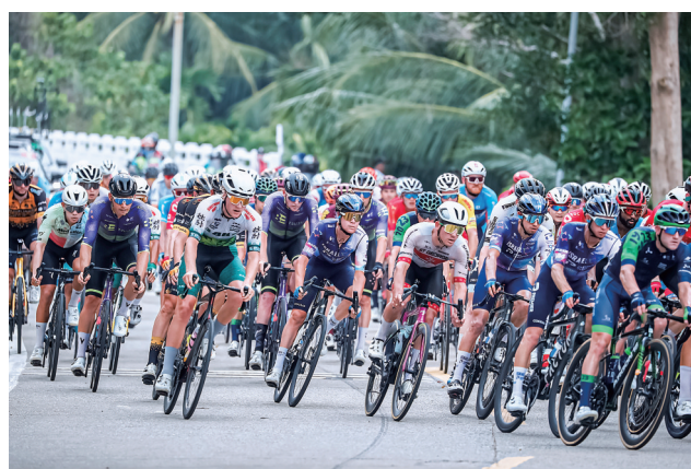
第十四届环海南岛国际公路自行车赛举行。