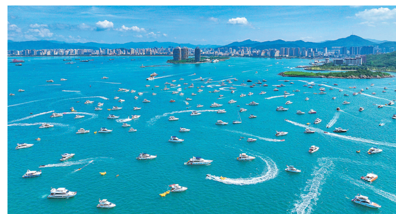
2023年国庆黄金周,三亚游客乘游艇出海,享受热带海洋风光。

刚刚过去的2023年,是不同寻常的一年。各大景区重现人潮涌动场景,众多城市街区烟火气升腾,无数人走出家门,奔赴远方看诗画美景,旅游业强势复苏回暖。