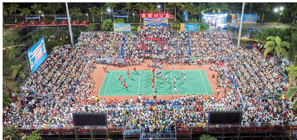
海南“村VA”总决赛在文昌精彩上演。