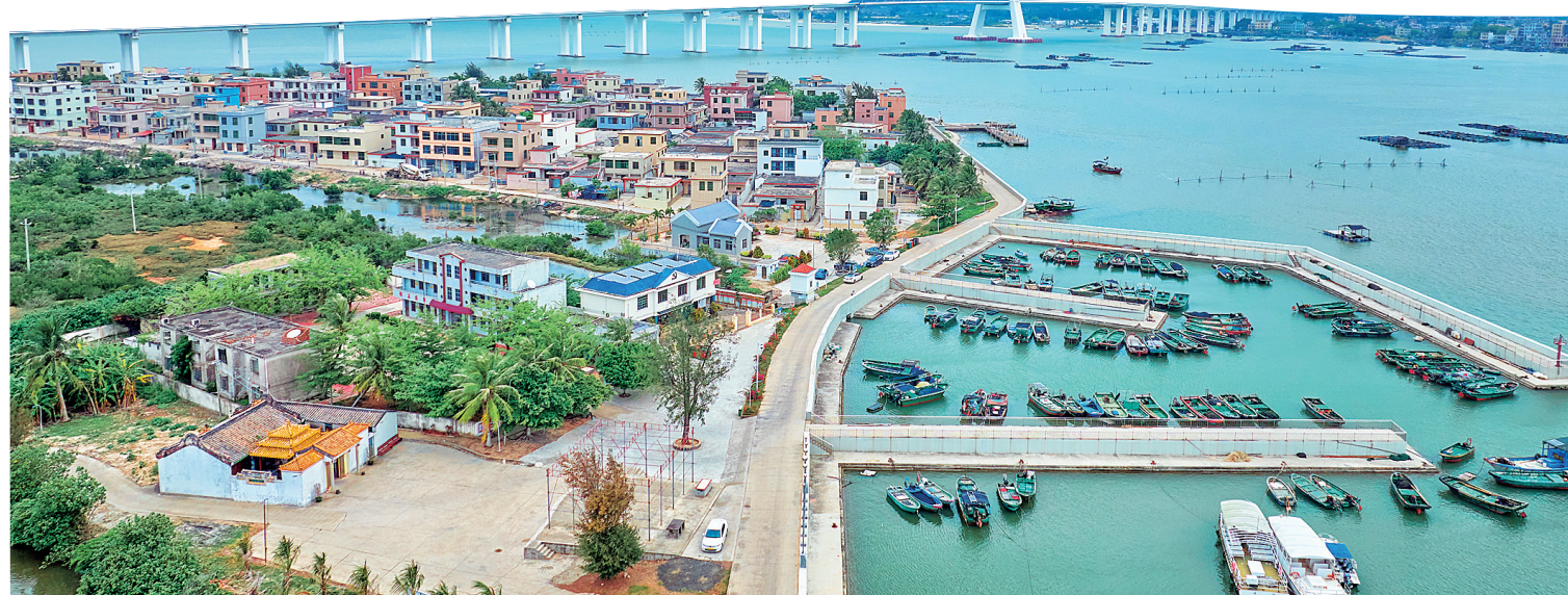
日新月异的北港村。