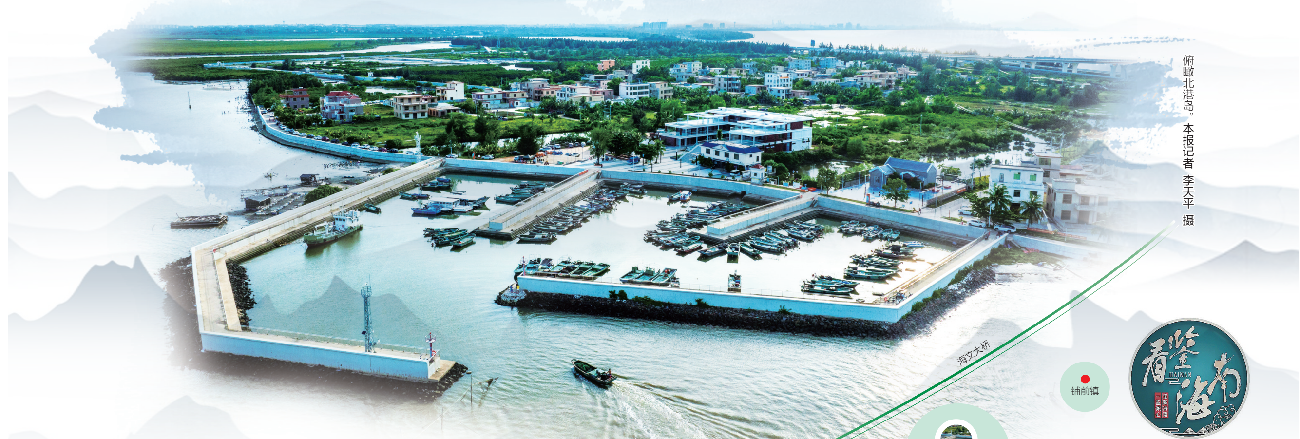
俯瞰北港岛。