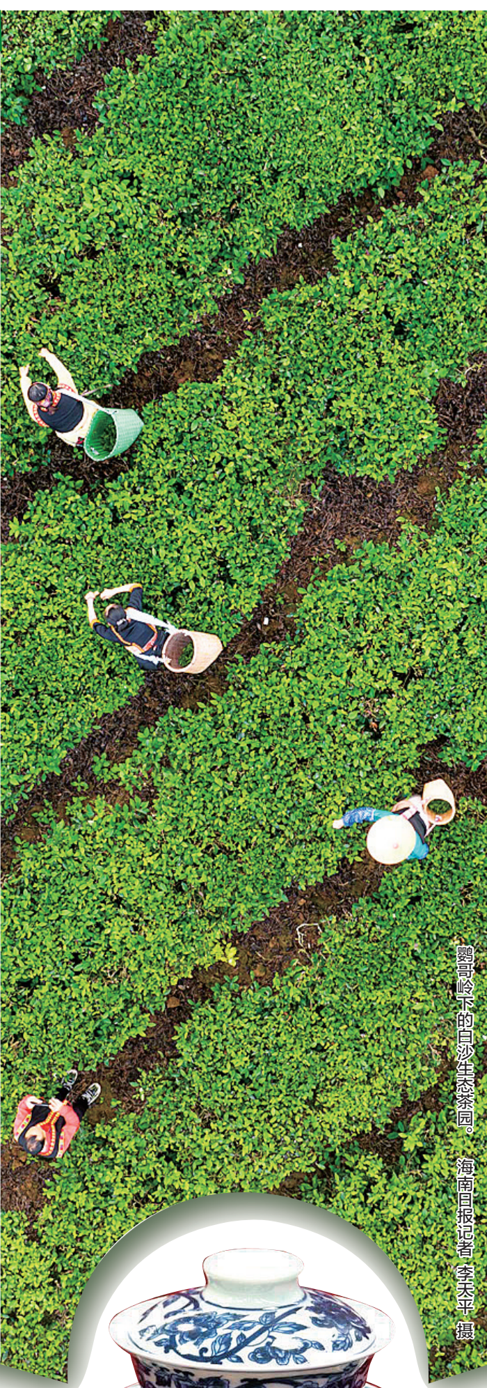
鹦哥岭下的白沙生态茶园。