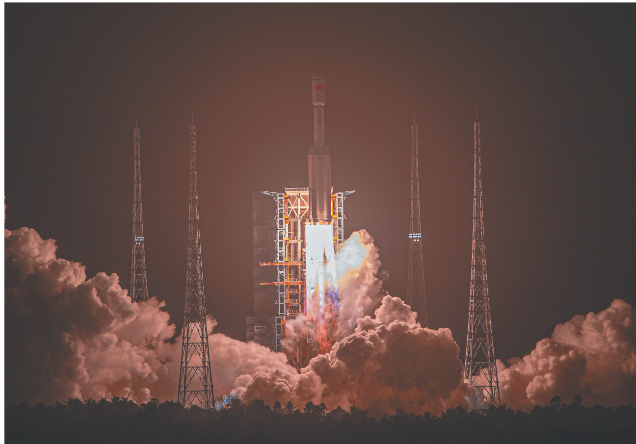
1月17日晚,搭载天舟七号货运飞船的长征七号遥八运载火箭在文昌航天发射场点火升空,随后将飞船精准送入预定轨道。

本报文城1月17日电(记者刘梦晓 通讯员黄国栋)据中国载人航天工程办公室消息,北京时间1月17日22时27分,搭载天舟七号货运飞船的长征七号遥八运载火箭,在我国文昌航天发射场点火发射。约10分钟后,天舟七号货运飞船与火箭成功分离并进入预定轨