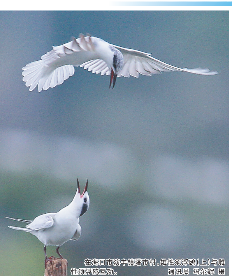
在海口市演丰镇塔市村，雄性须浮鸥（上）与雌性须浮鸥互动。通讯员 冯尔辉 摄

眼下，正是大量候鸟飞来海南越冬的时节。随着海南湿地生物多样性水平持续提高，越来越多的鸟类把这里当成“乐园”。一些来自全国各地的爱鸟人士也自发组织来海南观测拍摄前来越冬的珍稀候鸟。