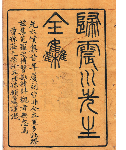
后世刊行的归有光全集书影。资料图

归有光死于南京太仆寺丞任上，故世人称之为“归太仆”。南京太仆寺是明太祖朱元璋于洪武六年(1373年)设置的官署，主要掌管马匹，以备军需。有意思的是，南京太仆寺不在南京而在