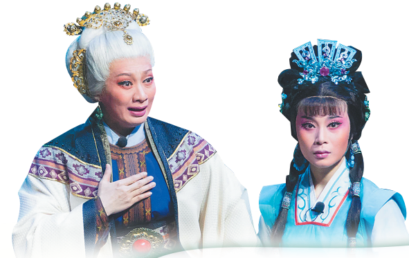
琼剧舞台上的洗夫人形象(左)。

其实在不同省市，春卷的来历和做法也不一样。如闽南春卷，是福建人为纪念郑成功而做，主要材料是海蛎；莆田春卷，是一位母亲为参加科考的儿子而做，以麦饼为皮、青菜为馅料，做法朴素又饱含母爱；海南春卷叫“脆皮高粱卷”，是用高粱饼卷着椰丝炸成的食物，属于琼海风味。 无论哪种特色春卷，对现代人来说，吃春卷只需要点个外卖，或者买来半成品油炸一下，但古人从“五辛盘”到“春盘”，从“春饼”到“春卷”，可是经历了近两千年的漫长发展。 “春到人间一卷之”，春卷不仅是自然的馈赠，更是华夏美食文化的漫漫传承。