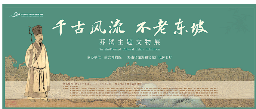
“千古风流 不老东坡——苏轼主题文物展”海报。

值得一提的是,此次展出的“宋四家”真迹等文物去年12月刚过“休眠期”。据故宫珍贵脆弱纸质文物保管、收藏规定,文物要设置“休眠期”,即每次展出后便要“休眠”3年。因此若错过此次展览,想再看到这些珍贵文物至少要再