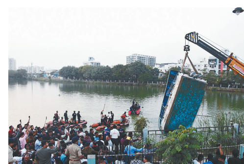
1月18日，在印度古吉拉特邦瓦多达拉，起重机将沉没的船只吊出水面。据当地媒体报道，参加野餐活动的一所学校师生遭遇沉船事故。