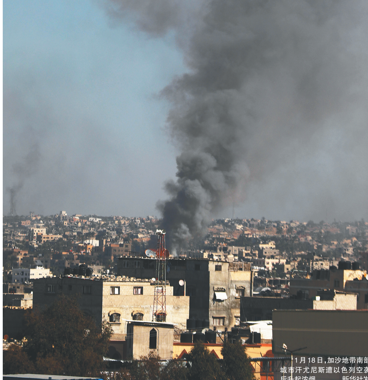
1月18日，加沙地带南部城市汗尤尼斯遭以色列空袭后升起浓烟。

国际社会普遍认为，解决巴勒斯坦问题的唯一出路在于落实“两国方案”，即建立以1967年边界为基础、以东耶路撒冷为首都、享有完全主权、独立的巴勒斯坦国，从根本上实现巴勒斯坦和以色列和平共存，实现阿拉伯和犹太两大民族和谐相处，实现中东地区持久和平。 对于内塔尼亚胡的说法，柯比18日回应：“我们显然有不同看法。”美国国务院发言人马修·米勒也说，如果巴勒斯坦不建国，以色列“不可能”解决其长期和短期安全挑战。米勒还说，美国没有“迫使”他国做事，只是在“提供机会”。 拜登与内塔尼亚胡通话当天，以色列国防军在加沙地带继续推进军事行动，并对加沙南部城市汗尤尼斯发动新一轮攻势。 加沙地带卫生部门19日发布的数据显示，以军过去24小时对加沙地带的袭击共造成142人死亡、278人受伤。去年10月7日新一轮巴以冲突爆发以来，以色列在加沙地带的军事行动已造成24762人死亡、6.1万多人受伤。 联合国方面的数据显示，新一轮巴以冲突已导致加沙地带至少190万人流离失所，约占加沙总人口数的85%。多家联合国机构本周早些时候呼吁以色列开放其南部港口城市阿什杜德，以向加沙地带运输人道主义援助物资。 阿什杜德距离加沙边境大约40公里。白宫19日在一份声明中说，内塔尼亚胡在通话中告诉拜登，以色列政府决定将面粉经由阿什杜德运入加沙地带，提供给巴勒斯坦民众，拜登对此表示欢迎。(郑昊宁)