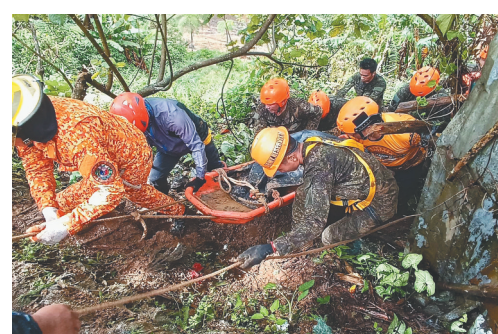
1月19日，在菲律宾金达沃省，搜救人员运送遇难者遗体。菲律宾南部金达沃省当地官员19日确认，18日发生的矿区山体滑坡死亡人数上升至10人。当地官员表示，金达沃省一个矿区18日发生山体滑坡，造成包括5名儿童在内的10人死亡，另有一人失踪。