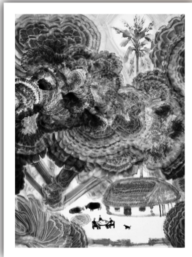
陈新华 国画《椰风·朗月·清茶》