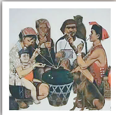
汤集祥 国画《合家欢》