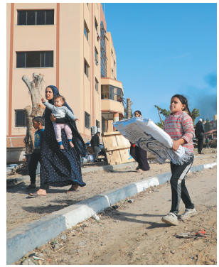
在加沙地带南部城市汗尤尼斯,人们逃离家园。

眼下,加沙地带人道主义危机严重、冲突外溢致中东多地燃起战火……以色列为何一直不肯罢休?巴以局势下一步将走向何方?新华社记者为您解局——