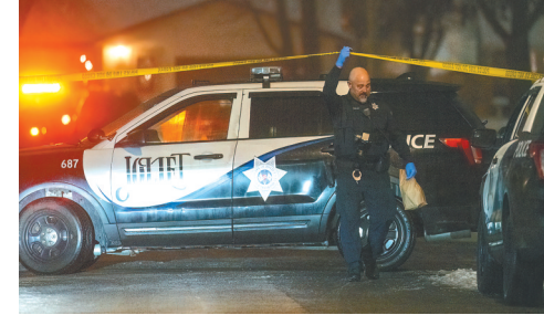
1月22日,警察在美国伊利诺伊州乔利埃特市的案发现场工作。

据新华社北京1月23日电(刘曦)美国伊利诺伊州警方22日说,一名男子自21日以来在芝加哥市郊区3处地点共枪杀8人,在另一起枪击案中致伤一人。嫌疑人行凶后逃至得克萨斯州纳塔利亚市附近,在同执法人员对峙时开枪自杀。