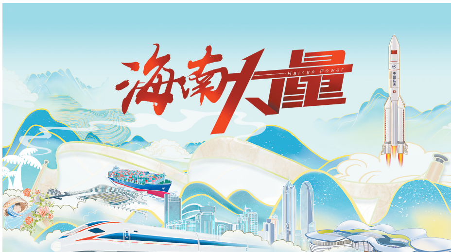
↑创意海报《这些KPI见证海南2023》 ↓创意短视频《海南力量》