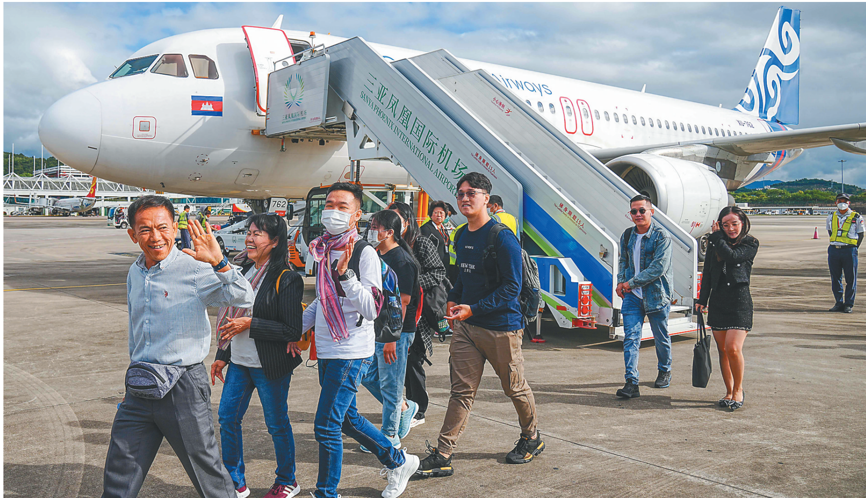
2023年12月1日上午9时许，自柬埔寨金边起飞，由柬埔寨航空公司(Cambodia Airways)执飞的KR9755航班飞抵三亚凤凰国际机场。图为来自柬埔寨金边的旅客走下客机。

“敲门”招商，“开门”迎客。省商务厅党组书记、厅长张斌说，今年，海南将继续利用省领导出访的机会，围绕世界500强重点企业开展精准招商，拓展全球招商机构布局，同时借助博鳌亚洲论坛年会、消博会等重要平台开展一对一招商。