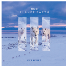
第六集笔记:极端之境。