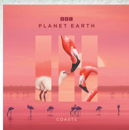
第一集笔记:海陆之间。

2023年底,自然类纪录片《地球脉动》第三季登陆上海广播电视台纪实人文频道,并同步上线多家网络平台。在豆瓣上,《地球脉动》第一季和第二季曾分别获得9.7和9.8的高分好评。《地球脉动》第三季坚持既有立场,在深度关注动物生存的同时,更关注动物与人类如何共处的问题,从而实现了自我超越。