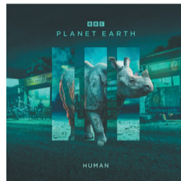
第七集笔记:与人共舞。