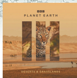
第三集笔记:广袤之地。