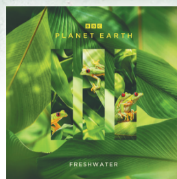
第四集笔记:滴水之源。