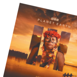
第八集 笔记:家园 卫士。