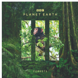
第五集笔记:林木之中。