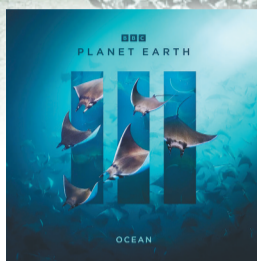
第二集笔记:波涛之下。