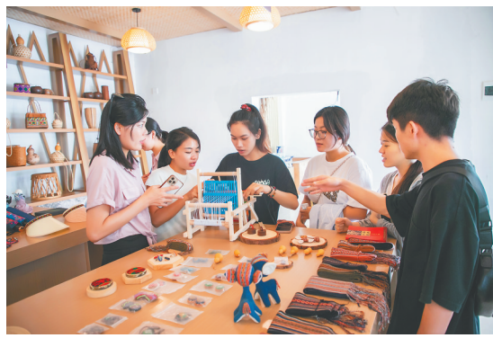
游客在东方市白查驿站的黎苗文化手工艺展销馆参观。

洪水村白查村，村还是那个村；船型屋还是那些船型屋，不同的是，船型屋“用”起来了，游人多了。