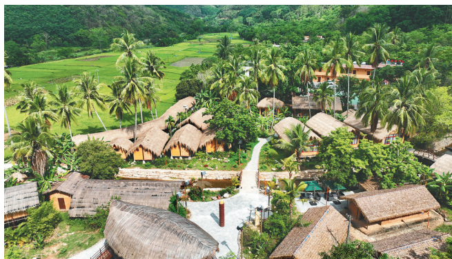
在昌江黎族自治县王下乡洪水村，船型屋掩映在青山脚下。

在洪水村度过4天3晚的静谧时光，让上海游客张一宁久久难忘。在这里，村里的船型屋模样依旧，但村外新增的白查驿站吸引了众多远道而来的游客。