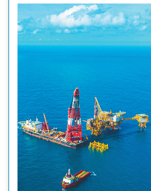
1月30日，俯瞰距离三亚市132公里的崖城13-1平台与“蓝鲸7500”主作业船，此时“蓝鲸7500”刚完成“深海一号”二期工程项目导管架坐底就位。