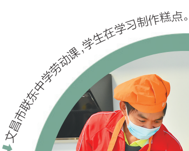
文昌市联东中学劳动课，学生在学习制作糕点。