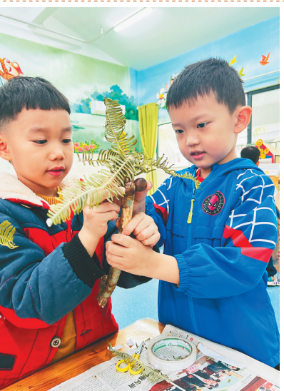
文昌市第二幼儿园学生在制作椰子树模型。

近年来，文昌积极打造“健康阳光、好学上进、勤劳诚信、文明朴实”的海南中小学生学习特色印记。各学校充分挖掘本土“红绿蓝”资源，多措并举，将本地红色人文、绿色生态、蓝色海洋航天的优势资源融入学校德育体系中，构建校本特色德育课程，促进基础教育高质量发展。