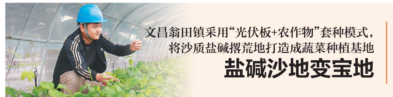
工作人员在查看秧苗生长情况。