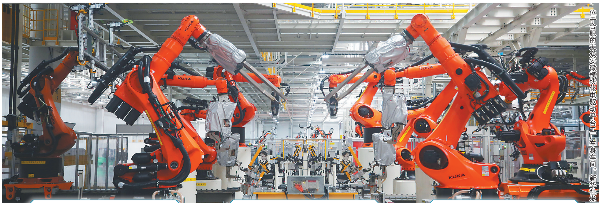
位于合肥的蔚来汽车模块化电驱平台后车身车间。

近期,地方两会上公布的一系列发展数据,印证2023年中国经济回升向好态势,尤其是经济发展中的新亮点令人鼓舞,为做好2024年的工作增加了信心和底气。出席地方两会的代表委员表示,要始终保持奋发有为的精神状态,以新气象新作为推动高质量发展取得新成效。