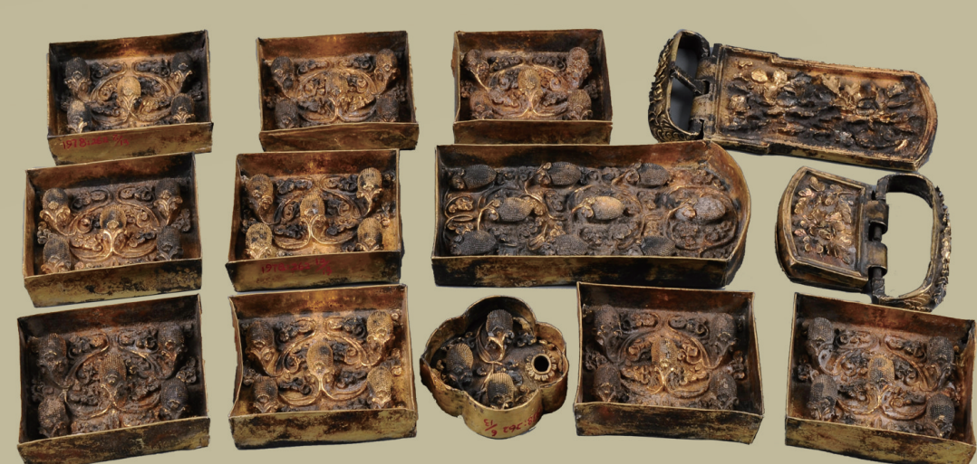
鍍金荔枝纹银带板