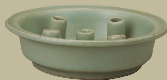
龙泉窑豆青釉五管瓷花插