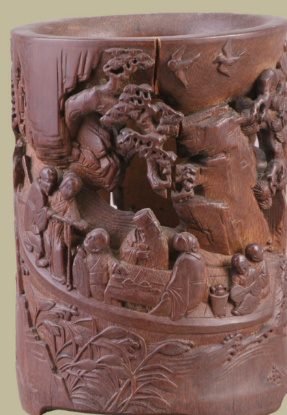
竹雕《东坡游赤壁图》笔筒