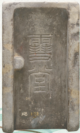
“雪堂”款端石抄手砚，一级文物。杭州市临平博物馆藏