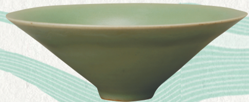
龙泉窑梅子青釉瓷斗笠碗，一级文物。四川博物院藏