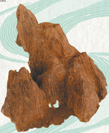
沉香摆件。海南省博物馆藏

苏轼一生，读万卷书，亦行万里路。他年少时在四川眉山修身养志，弱冠出蜀入京，风华无双；在朝经年，以贤良方正之初心，谏诤于朝廷，又因不合时宜之主观，窘窘于党争；历史八州，鞠躬尽瘁，三度贬谪，亦留下不朽功业。