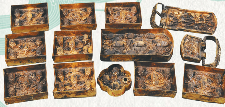
北宋镀金荔枝纹银带板，一级文物。江西省博物馆藏