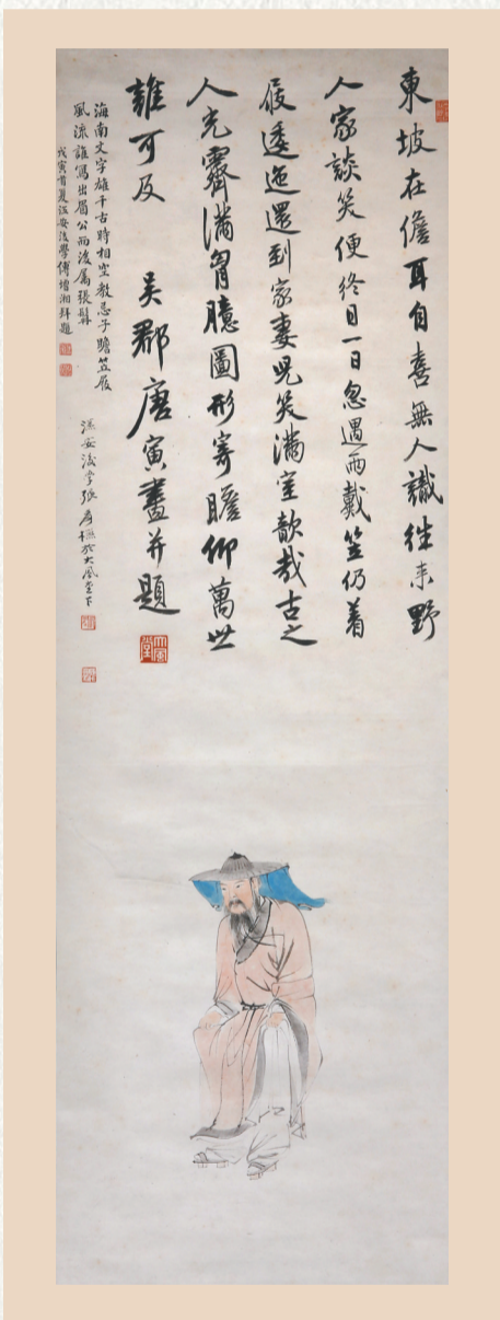
张大千仿唐寅《东坡笠屐图》轴。天津博物馆藏

海南省博物馆举办的“不老坡仙 梦回千年——苏东坡主题文物展”，将坡翁居儋轶事，尤其是“东坡笠屐”“一蚝二吃”等掌故，以实物的形式得到了活活泼泼的展现。