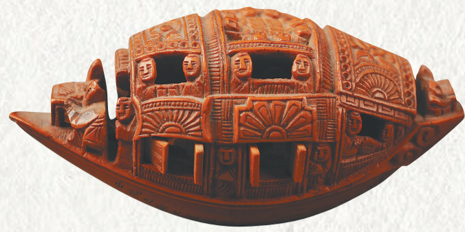
清光绪《东坡游赤壁》微榄核雕。济南市博物馆藏