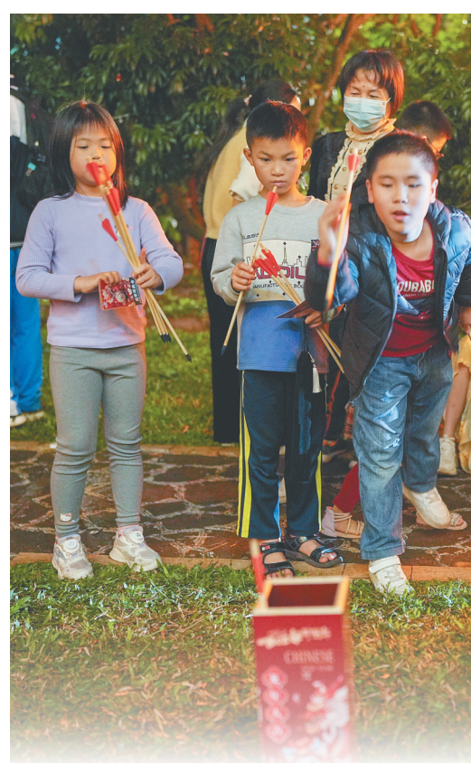
一月三十一日晚，参观苏轼主题文物展的小朋友体验投壶。