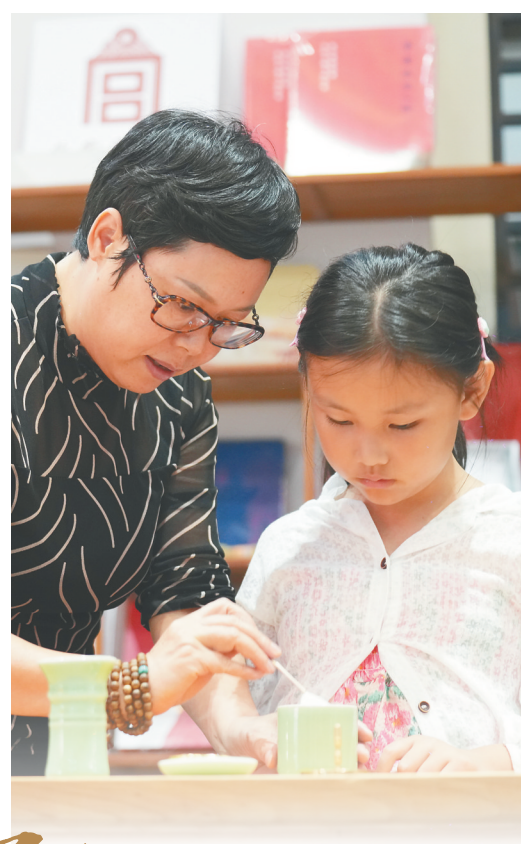
一月三十一日晚，小朋友在东坡集市体验“宋四雅”之焚香。