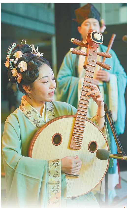
一月三十一日晚，苏轼主题文物展开幕式上的民乐表演。

我们为什么爱苏东坡？爱其才能，爱其豁达，爱其至纯至善至真。那么，当这样一位可爱的老朋友来到“家门口”，你还不会去会一会吗？