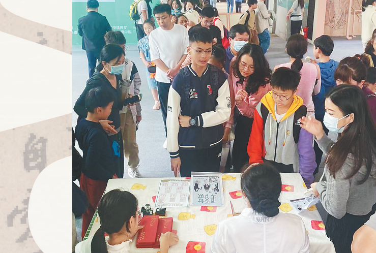
2月1日,海南日报报业集团联合省博物馆开展苏轼主题文物展打卡活动。