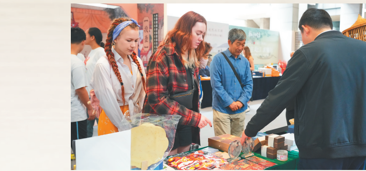
2月1日,在省博物馆东坡集市,外籍观众选购文创产品。