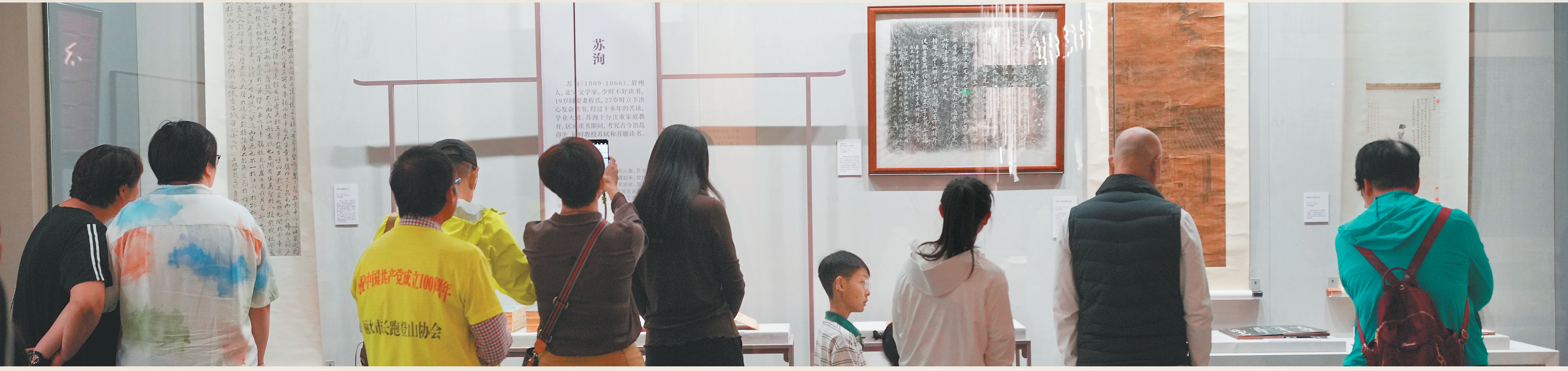
公众开放吸引众多市民游客前来观展。2月1日,“千古风流 不老东坡——苏轼主题文物展”面向公众