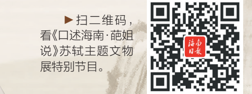
▶扫二维码,看《口述海南·她姐说》苏轼主题文物展特别节目。