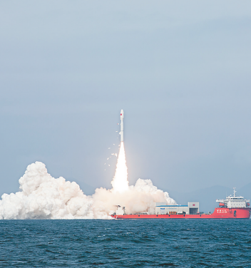
图为2月3日广东阳江附近海域发射现场。

新华社广东阳江2月3日电(杨晓敏 李豪)2月3日11时06分，我国太原卫星发射中心在广东阳江附近海域使用捷龙三号运载火箭，成功将DRO-L星、智星二号A星、东方慧眼高分01星、威海壹号01-02星、星时代-18-20星以及NEXSAT-1星等9颗卫星发射升空，卫星顺利进入预定轨道，发射任务获得圆满成功。