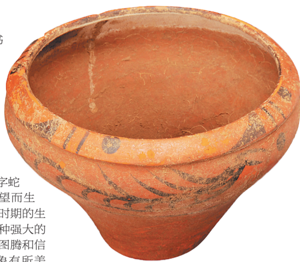
仰韶文化鸟龙纹彩陶盆。资料图

从上古图腾到吉祥瑞符，“龙”在中华五千年的历史长河中逐渐演变为中华民族的精神象征与文化符号。从这个角度上说，“龙行龘龘”的春晚主题不仅展示了龙的浩行千里、威武雄壮，同时也展现了全国上下自强不息、奋发向上的精神风貌。固