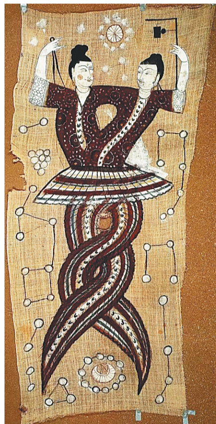
唐代画作《伏羲女娲图》。资料图