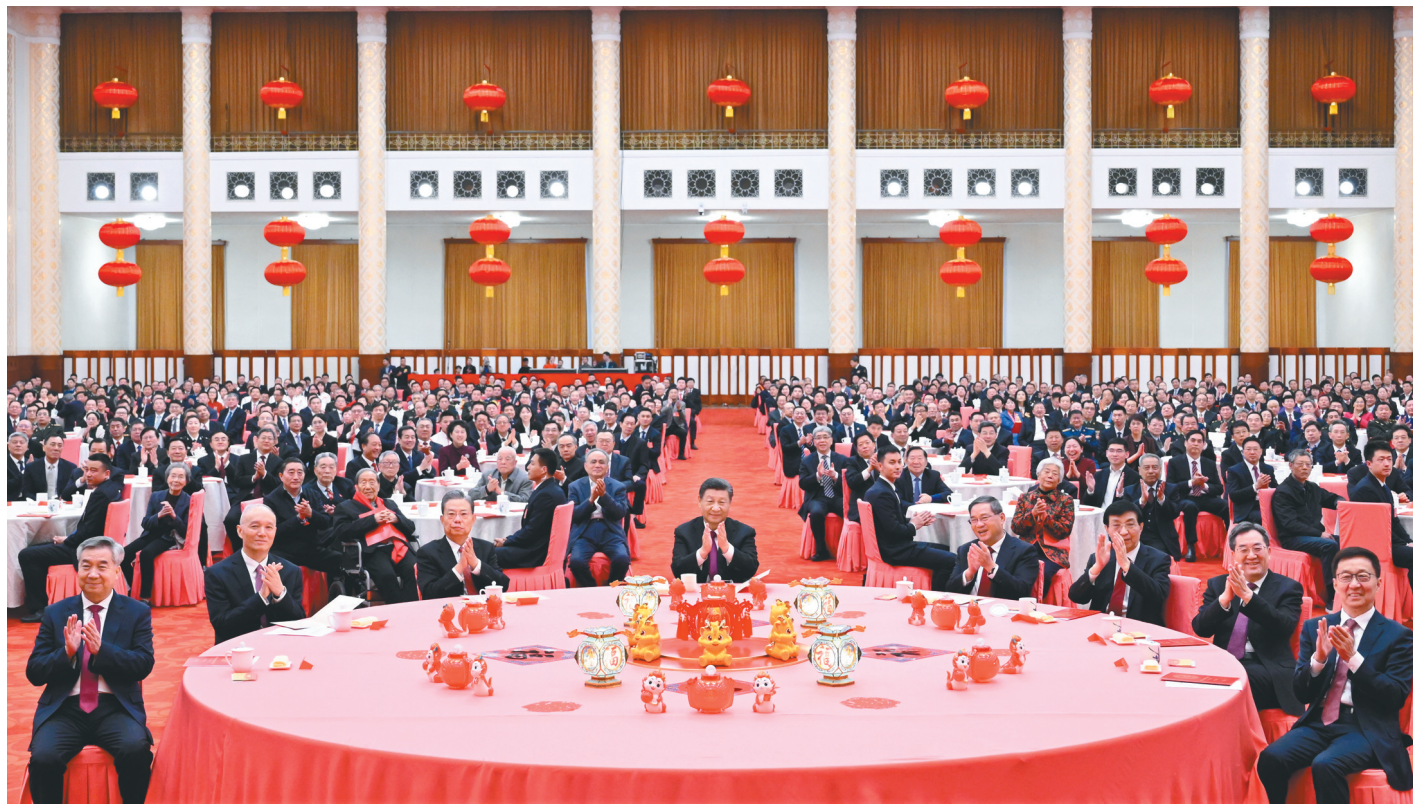
2月8日,中共中央、国务院在北京人民大会堂举行2024年春节团拜会。中共中央总书记、国家主席、中央军委主席习近平发表讲话。