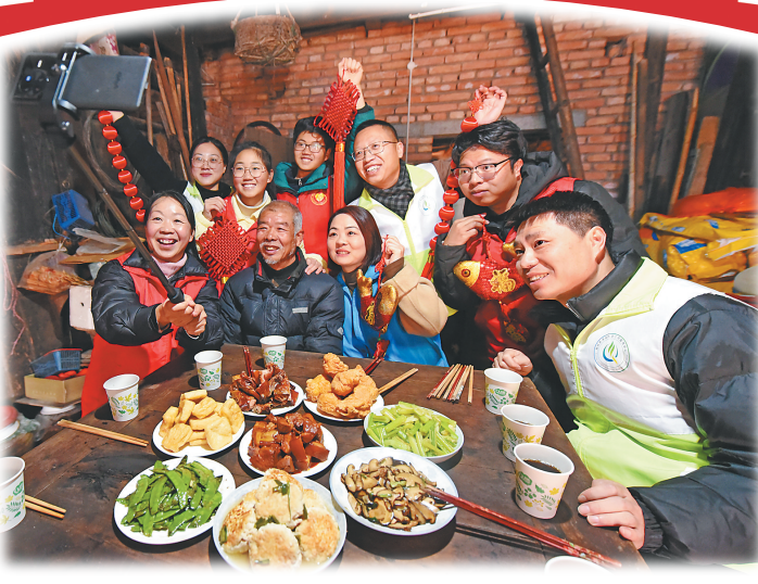
2月9日，浙江省台州市仙居县社会组织党群服务中心的志愿者来到白塔镇黄龙村慰问孤寡老人。

据新华社北京2月9日电(记者任沁沁)中国路网预计，春节假期公路网流量将呈现“前低后高”的特征，除夕、初一为假期低谷，正月初二起逐步回升，正月初八集中返程，出现春节期间最高峰。春节期间出行与节后返程的潮汐特征明显，9至12时和14至19时为易发生拥堵时段。 今年春运的一大考验，是大范围雨雪冰冻天气与节前出行高峰重叠。由于气温较低，雨落地结成冰，光滑坚硬如铁甲，易形成“地穿甲”，影响行车安全。 交警部门提醒，遭遇低温雨雪冰冻天气，应尽可能避免自驾出行。确需驾车出行，要降低车速、保持车距、谨慎驾驶。行驶中应严格控制车速，和前方车辆保持1.5至3倍车距。行车途中如果出现侧滑或甩尾现象，千万不要惊慌，把方向盘顺着打滑方向轻轻地控制，待车辆回正后，再轻踩刹车，防止车辆失去控制。 南方公众遇强降雪天气或自驾到北方旅游时，一定牢记“慢”和“柔”，打方向盘、踩油门刹车等各项操作尽量轻柔。在冰雪路面行驶，尽量减少变线、超车，尤其是不在弯道超车。 雨雪天气结束后，收费站、桥面、隧道出入口以及坡上路段等位置可能出现“暗冰”，路面摩擦系数降低，容易打滑，行驶桥梁、隧道、涵洞前提前减速，保持较低车速，切忌急刹车或超车。 新手司机若选择自驾回家，切勿对自己的驾驶水平盲目自信，须严格遵守交通法规，在熟练人员的陪同下驾驶机动车。 如果在高速公路发生事故，牢记“车靠边、人撤离、即报警”防范二次事故，快速将车辆移动至应急车道，及时在来车方向150米以外放置警告牌，车上人员及时撤离至高速公路护栏外等安全区域，切勿在车辆周边逗留。