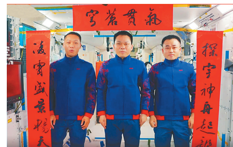
2月9日，农历除夕，正在太空出差的神舟十七号航天员乘组送来龙年新春的祝福。

2月9日，农历除夕，正在太空出差的神舟十七号航天员乘组从我们的“太空之家”中国空间站送来龙年新春的祝福。 贴春联、挂灯笼、系中国结……在浩瀚太空，中国空间站内“年味儿”十足。 作为我国载人航天工程进入空间站应用与发展阶段后首个在太空过大年的航天员乘组，3名航天员特意穿上了喜庆的“祥云服”，把中国人自己的“太空家园”仔细装扮了一番。 即便身处太空，年夜饭也不可少。今年中国“天宫”里的年夜饭，依旧有饺子、桂花芝士年糕、八宝饭，还有寓意“十全十美”的八珍鸡、老汤牛肉等十大菜肴。除此之外，航天员还可以与家人朋友打电话，在轨收看春晚。 在太空中过春节、享“年货”，离不开科技实力的“硬支撑”。 不久前，天舟七号货运飞船从海南文昌出发，除携带多个科学载荷和空间站所需的物资、补给外，还专门为航天员送去龙年春节“年货”和新鲜果蔬大礼包。 天舟七号是世界现役货物运输能力最大、货运效率最高、在轨支持能力最全的货运飞船。如此强大的“带货”能力，离不开航天科技工作者日复一日、年复一年的攻关与探索。如今，我们还在为研制更强大的货运飞船不懈努力。 航天是一项“万人一杆枪”的事业，在飞行控制中心、测控站、在大漠戈壁、在大山深处，万家团圆时，航天工作者们依然坚守岗位，尽百分努力，精准实施空间站运行管理，保障航天员在轨健康和高效工作。 习近平总书记指出，建造空间站、建成国家太空实验室，是实现我国载人航天工程“三步走”战略的重要目标，是建设科技强国、航天强国的重要引领性工程。 曾几何时，在太空拥有自己的空间站，是一个遥远的梦。经过我国广大科技工作者奋斗拼搏，梦想已经成为现实。